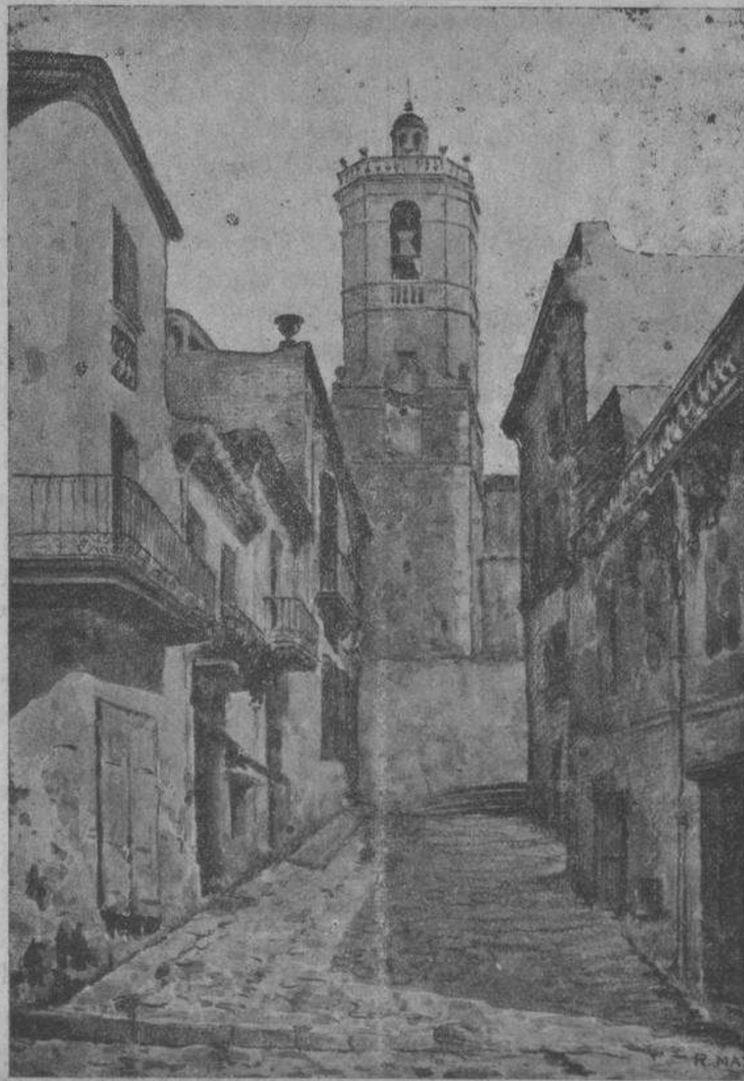
UNA CALLE DE LLAGOSTERA