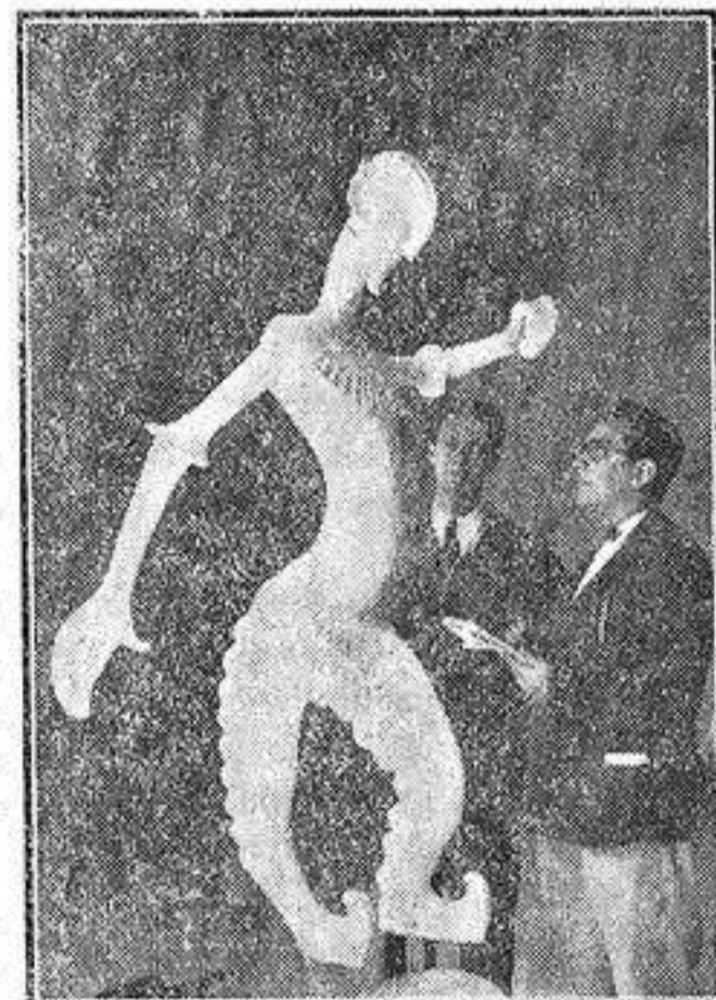
El marciano hablando con Castelló y nuestro redactor.

A los pocos días de aquel barro fueron surgiendo figuras. Sobre la pauta de un dibujo elegante, las pelias de barro adquirían forma lentamente. Terminada la jornada las figuras esperaban pacientemente al artista bajo un lienzo húmedo que cubría la vergüenza de sus muñones. Recordamos un dramático grupo de emigrantes. Un pensador de fino trazo. Del barro original no queda más recuerdo que le de una fotografía antes de pasar a materia tan poco