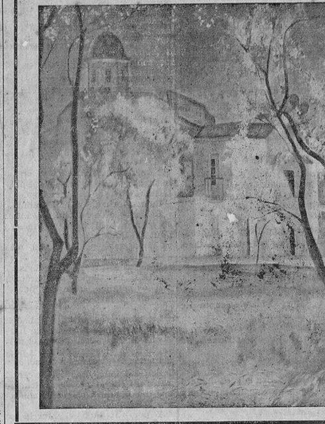
Una calle de Santa Faz, cuadro de Varela