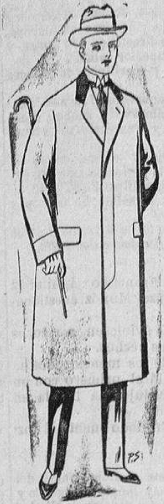
Gabanes de paten, chiviot ó melton De 25 a 100 ptas.

Madrid, Barcelona, Almeria, Bilbao, Cádiz, Cartagena, Gijón, Granada, Málaga, Palma de Mallorca, Santander, Sevilla, Valencia, Valladolid y Zaragoza.