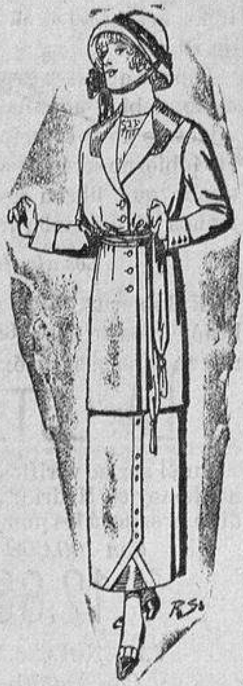
Traje de lana para jovencitas de 14 a 16 años. De pesetas 40 a 45.