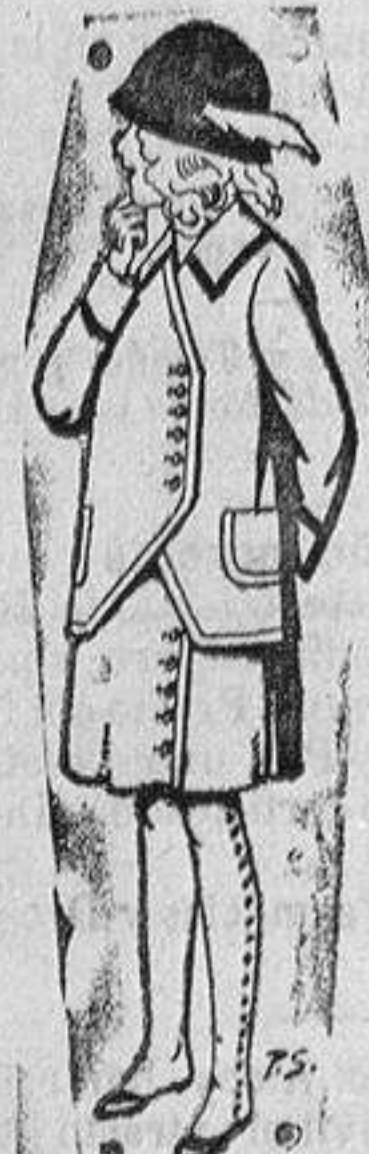
Trajes para niñas, de 4 a 11 años. De ptas. 14 a 17.

Madrid, Barcelona, Almeria, Bilbao, Cádiz, Cartagena, Gijón, Granada, Málaga, Palma de Mallorca, Santander, Sevilla, Valencia, Valladolid y Zaragoza.