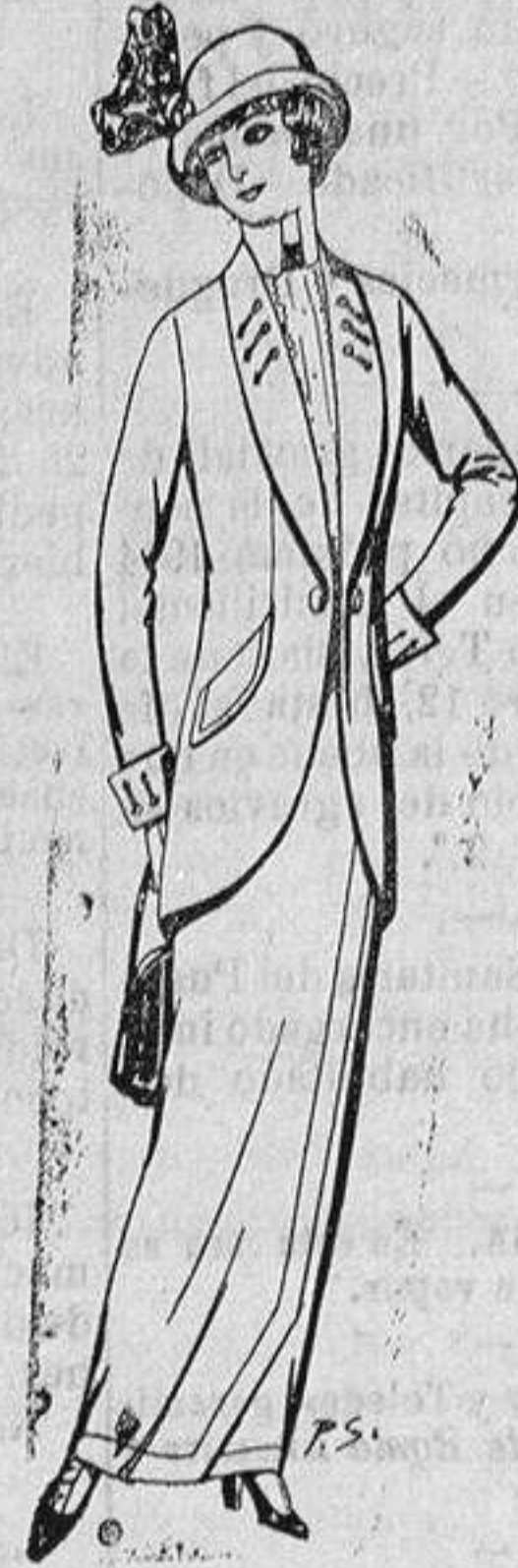
Traje de lanilla ó cheviot para Señora á Ptas. 65 y 70