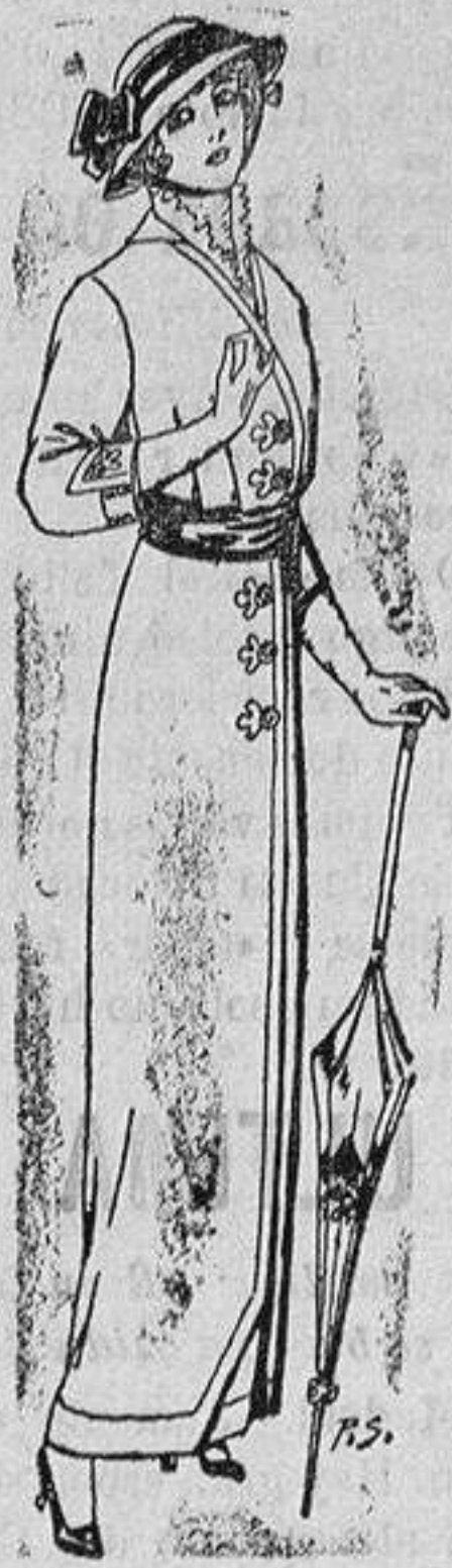
Vestido de lanilla negro ó azul para señora, á Ptas. 22