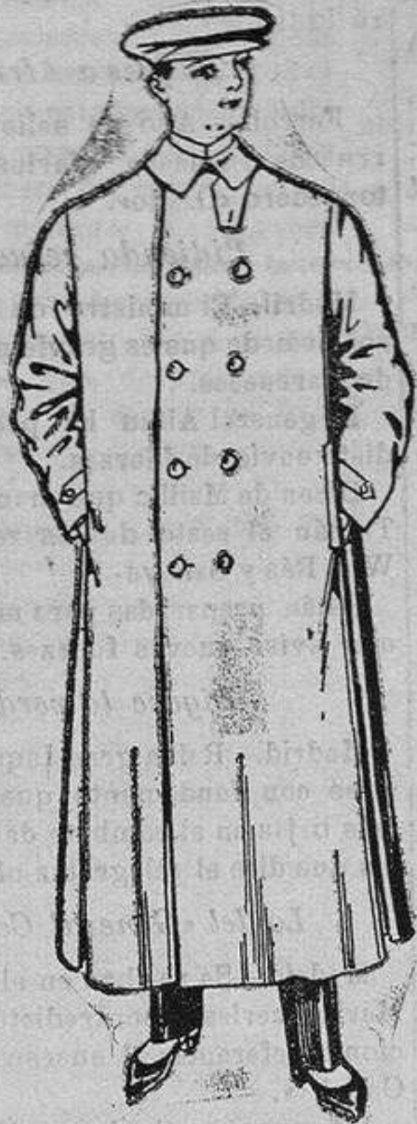
Guardapolvos de dril de Pesetas 8 a 25