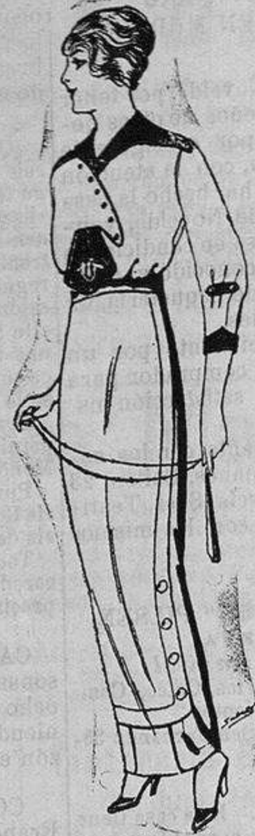
Blusa de seda blanca y colores, adornos bordados de Ptas. 25. Faldas de lana de Ptas. 11 a 22.

Ropas confeccionadas para Caballeros y Niño y Artículos de la Temporada