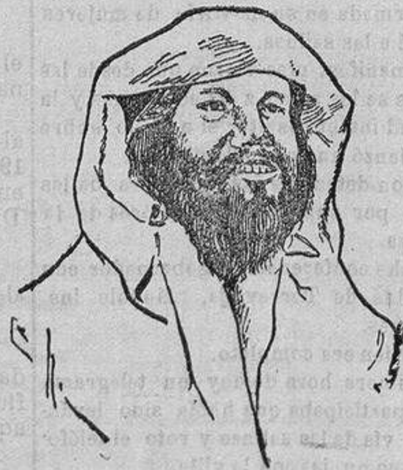
EL RAISULI a quien se erce promotor y director de la actual explotación de África