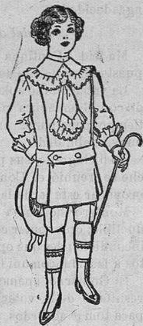
Traje de jerga azul ó alpaca blanca para niños de 4 á 10 años de Ptas. 26 á 35

Ropas confeccionadas para Caballeros y Niño y Artículos de la Temporada