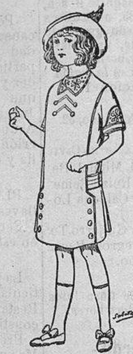
Vestidos de seda para niñas de 4 á 10 años de Ptas. 22, 24 y 26

Trajes de lana forma sastre para Señora . . . de 25 á 100 ptas. Trajes de dril, forma sastre, para Señora . . . de 14 á 40 > Vestidos de seda, lino, batista, etc. . . . . de 14 á 85 > Trajes lana ó dril para Niño . . . . . de 7 á 30 > Refajos de seda ó algodón . . . . . de 3 á 50 >