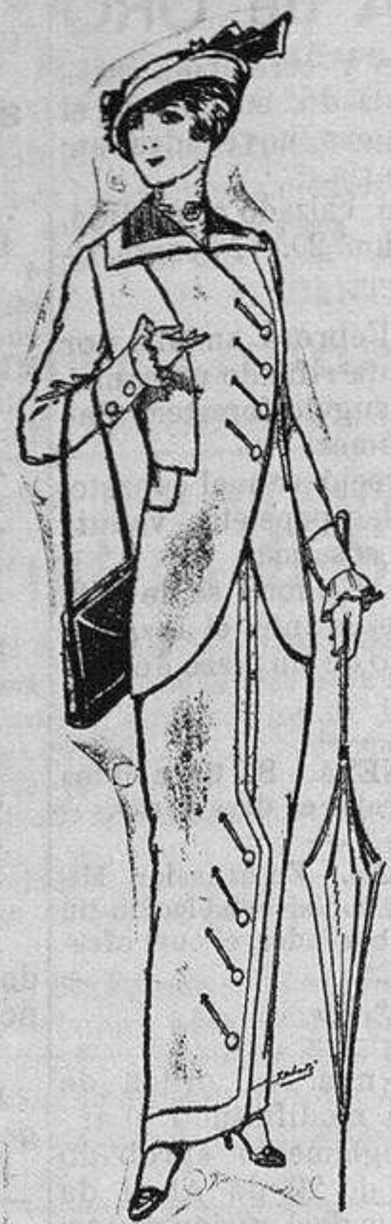
Traje jerga para Señora á Ptas. 65 y 75