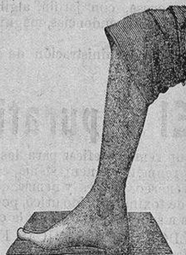
Después de la curación