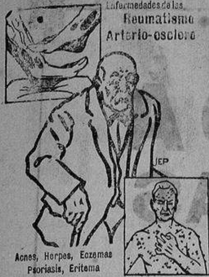
Las enfermedades de las Reumatismo Arterio-esclerosis