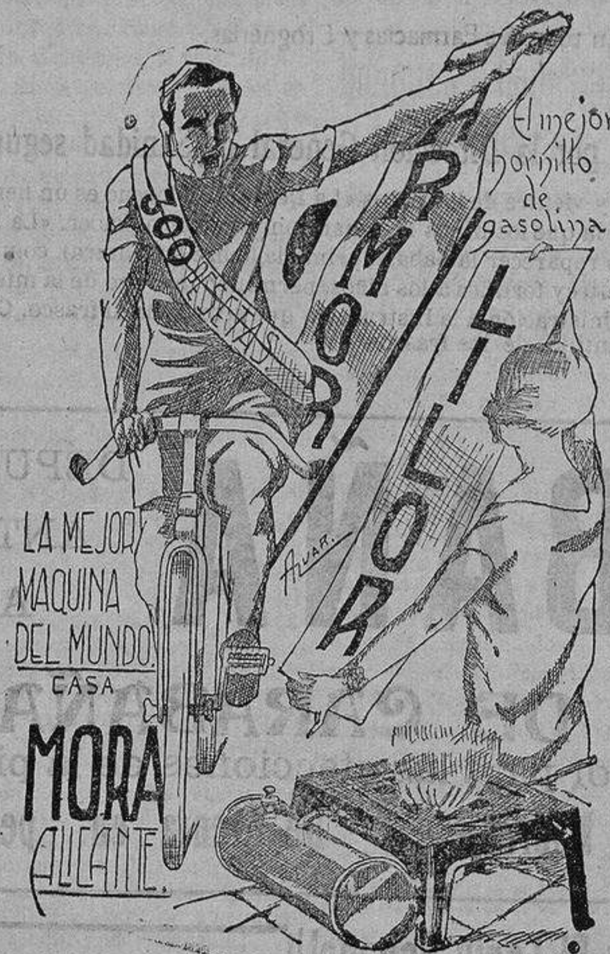
LA MEJOR MAQUINA DEL MUNDO. CASA