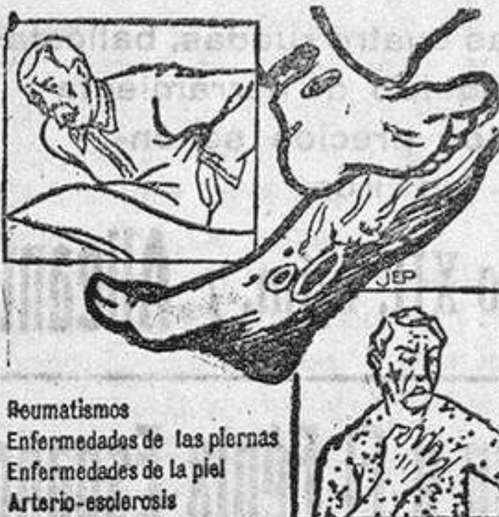
Rumatismos Enfermedades de las piernas Enfermedades de la piel Arterio-esclerosis

Varsovia, (telégrafo).—Chamberlín y Levine son objeto de grandes agasajos. Ambos se proponen estar el día 4 de Julio en Londres, donde permanecerán hasta el día 12, que emprenderán el viaje de regreso.