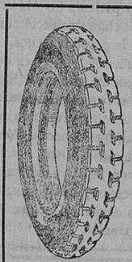
La cubierta recauchutada que le devuelve la fábrica.

que si usted adquiriera una cubierta nueva le dejaremos la que nos entregue rota para recorrer 20.000 kilómetros más.