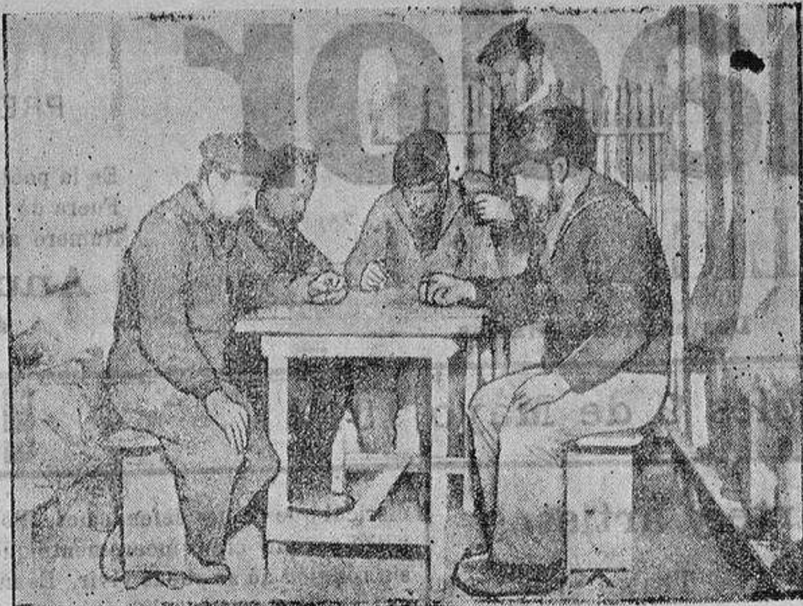
Artilleros marinos en un puesto subterráneo

Nosotros, hemos estado sobrecogidos mientras ante el piano Rubinstein arrancaba los sonidos que modulaba, bajo la voluntad de sus dedos, hasta dominar el instrumento y ver crecerse su figura, que se erguía y encogía en la silla, mientras su cabeza inclinábase hacia atrás ó hacia adelante y sus ojos entornábanse ó abrían, según la sensación que sus manos producía al recorrer el teclado.