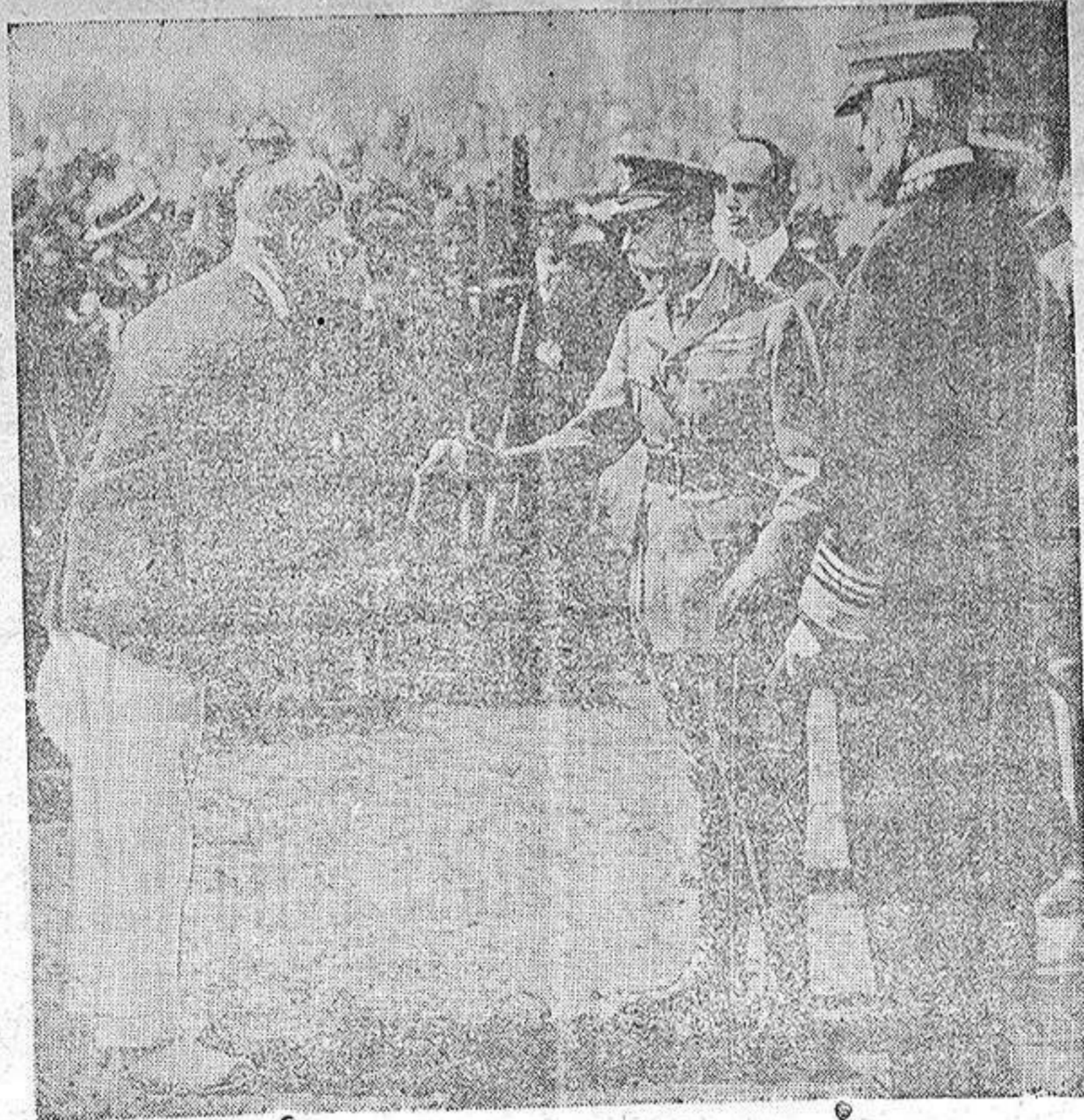
Oficiales de la Cruz Roja Americana presentados al rey Jorge de Inglaterra