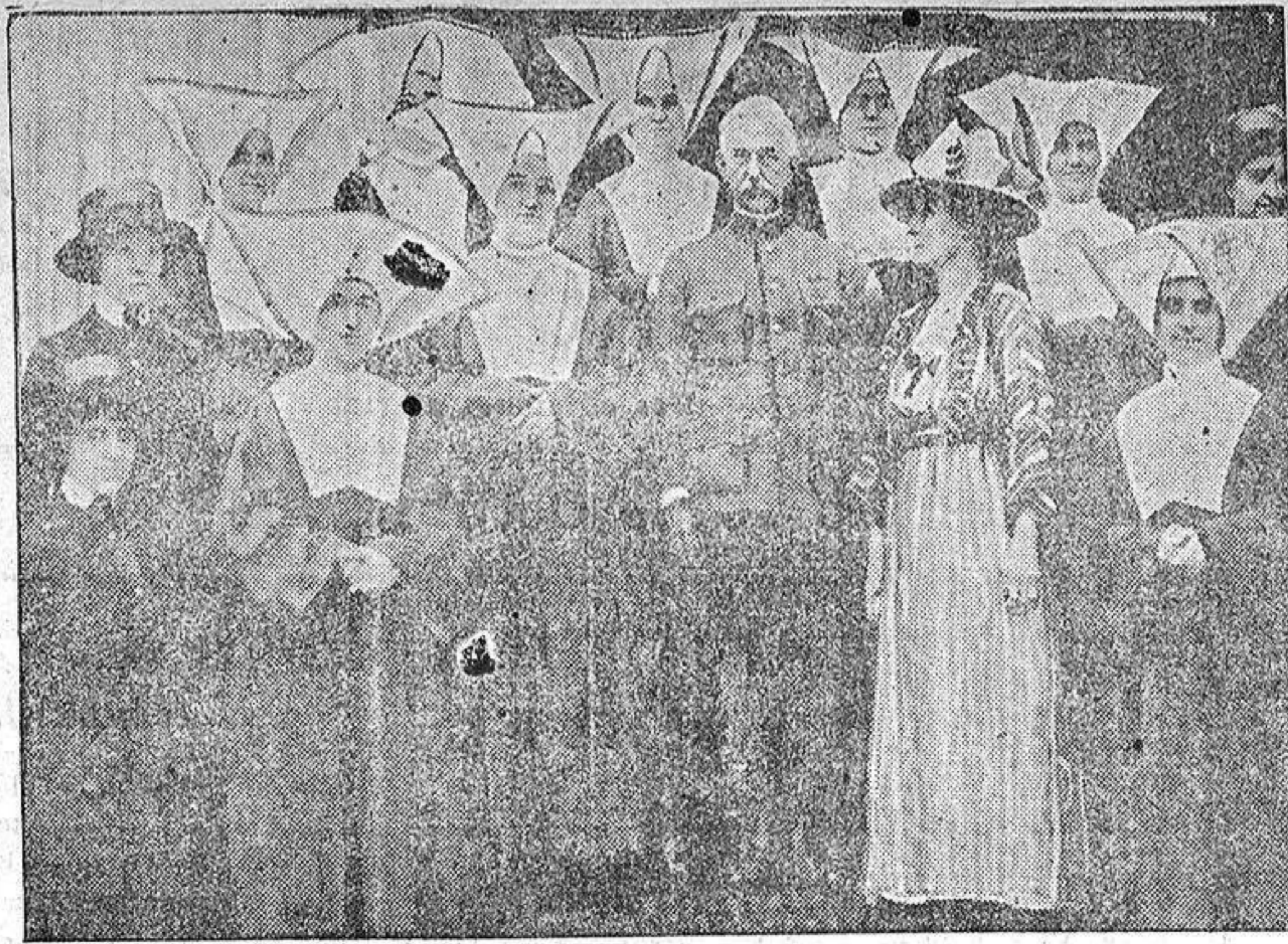
El médico Mayor, general William Crawford, rodeado de un grupo de enfermeras

Un libre pensador, un racionalista, un ateo inclusive, puede contraer nupcias con cualquier mujer de ideas y creencias opuestas per completo a las suyas, en materia religiosa. Enamorados mutuamente ambos cónyuges, su vida matrimonial ha sido continuo idilio. Vivieron juntos, y