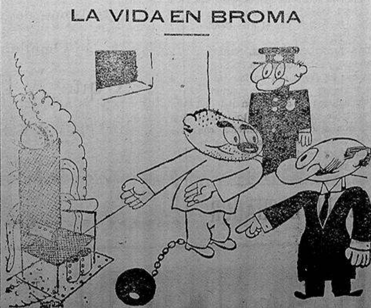
URBANIDAD El condenado a la silla eléctrica.—De ninguna manera, señor, siéntese usted

Se levantó la sesión a las ocho y media.