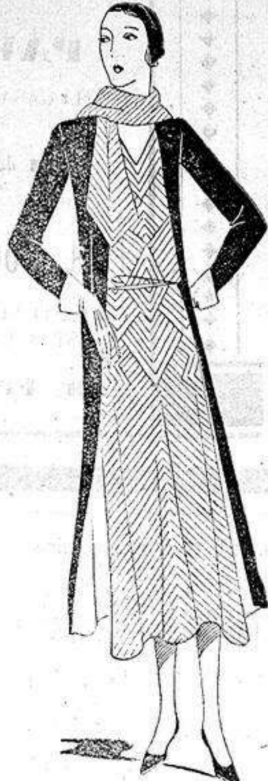
Vestido de crepé de china impreso, trabajado en sentido diferentes. Mantón de lanita marino.

Y este es el error de la mayor parte. Muchas son las mujeres que