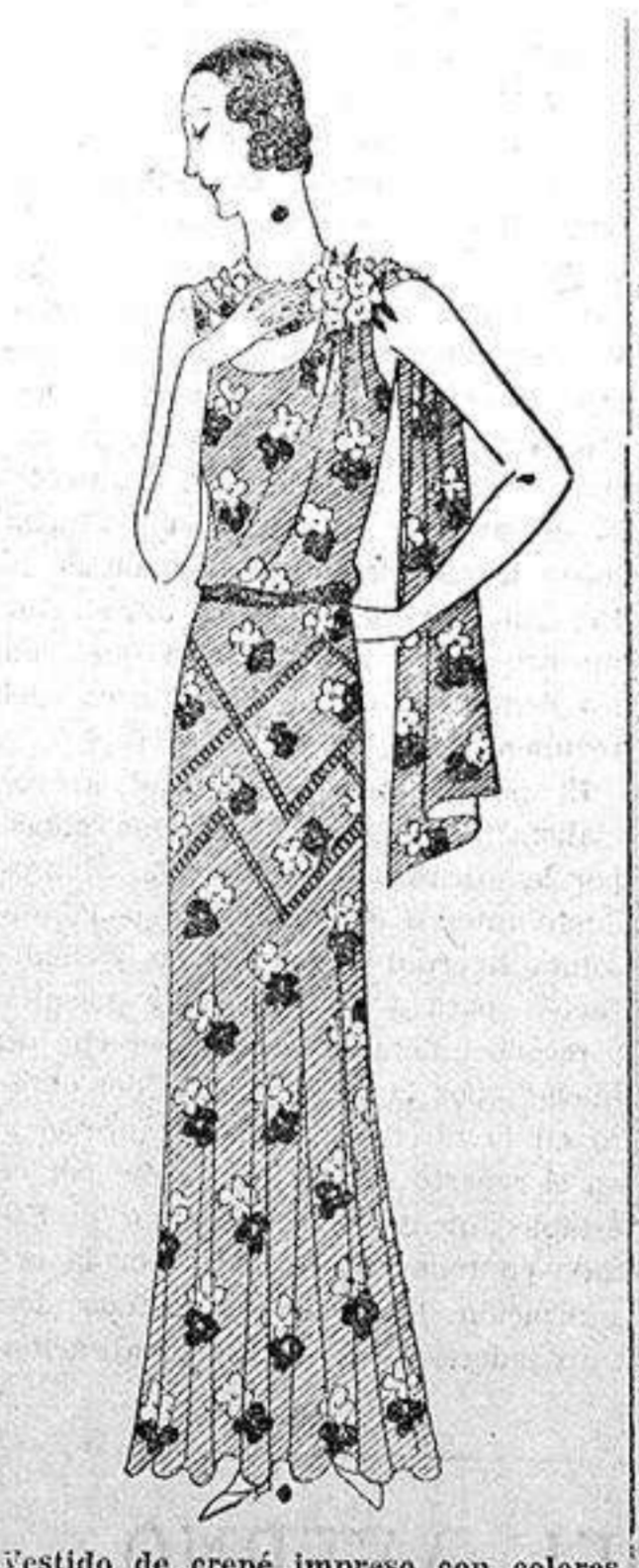
Vestido de crepé impreso con colores vivos, echarpe y flor del mismo tejido que el vestido.

La mamá cuidadosa de la educación de sus hijos, que lea para aprender lo que debe hacer y de qué cosas conviene abstenerse, cuando haya consultado algunos tratados de pedagogía, se quedará sin duda más indecisa que antes, pues mientras unos le dirán que debe referir a sus hijitos todos los cuentos de hadas que sepa y pueda aprender, otros se lo prohibirán amenazándola con graves males.