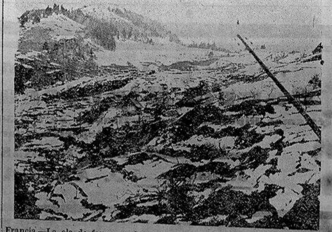
Francia.—La ola de fango en Saboya.—La ola de fango, viniendo del Bosque del Infierno, se dirige hacia Chatelard.