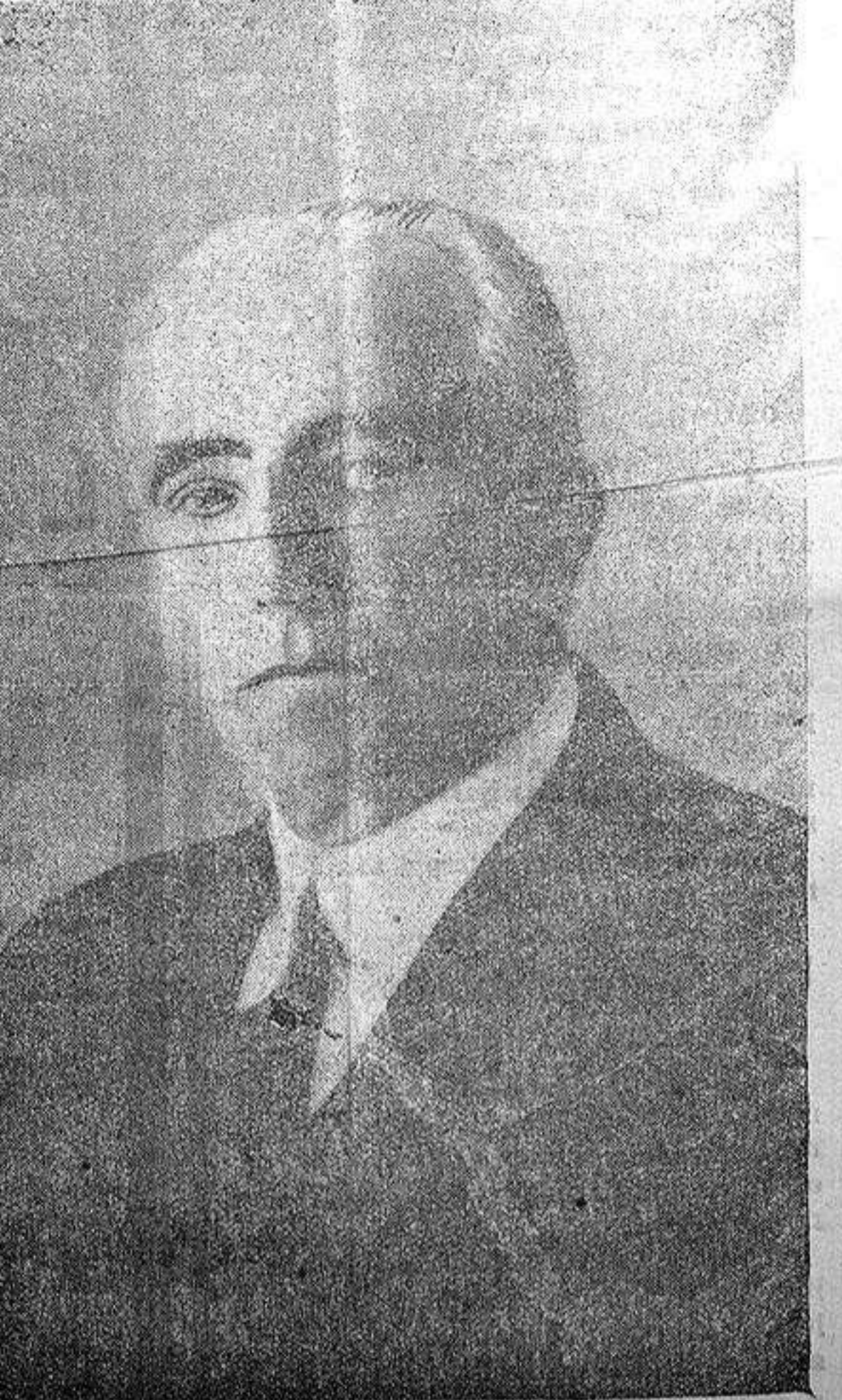
El eminente cantante Mardones que, como en años anteriores, pasa la estación invernal en Alicante

ALICANTE Junta general ordinaria En cumplimiento a lo que dispone el artículo 23 del Reglamento por que se rige este Círculo, se convoca a los señores socios del mismo a la Junta general ordinaria que en UNICA convocatoria tendrá lugar en el domicilio social, el domingo día 28 del actual a las horas que se citan, para tratar de los asuntos enumerados en el siguiente ORDEN DEL DIA (De las 10'30 horas a las 19 artículo 31).