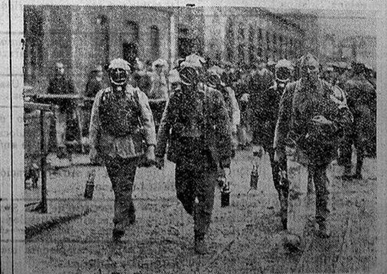
La catástrofe de Maybach (Sarre). Los salvadores dirigiéndose al lugar de la catástrofe.