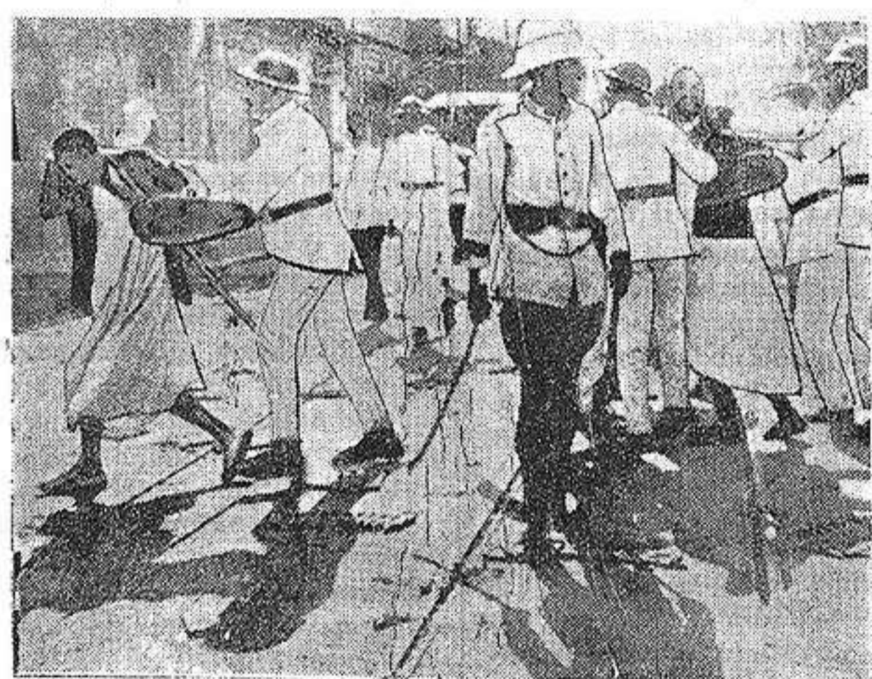
Las Revueltas en Egipto.—El Cairo.—La policía dispersando a los manifestantes a palos.