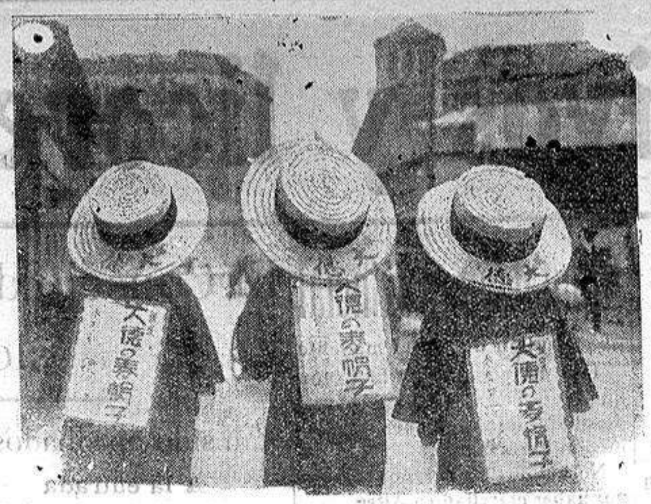
Instantánea de la calle, en Tokio.—Tres hombres sandwiches japoneses.

Se necesita taller en esta plaza para la confección de toda clase de prendas para caballero. Dirigirse a Vidal (hijo) de Elda.