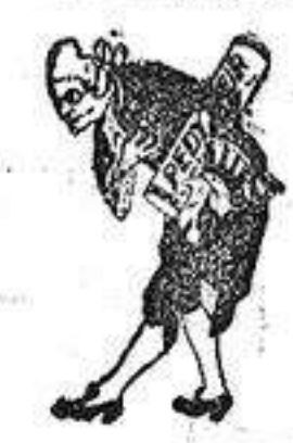
A los pies de Vd.

El maravilloso baño de pies PEDIKUR ha conseguido hacer andar sin sufrir a cuantos alicantinos lo han usado, pues permite llevar el calzado ajustado sin que se hinchen, recalienten o duelan los pies, junetes, o callos por mucho que se ande, gracias a que aumenta considerablemente su resistencia al cansancio y al calor. Vea usted estas pruebas recientes: