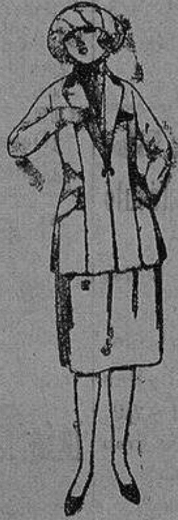
Trajos de sarga inglesa, gabardina etc., en azul y color. de ptas. 35 a 160