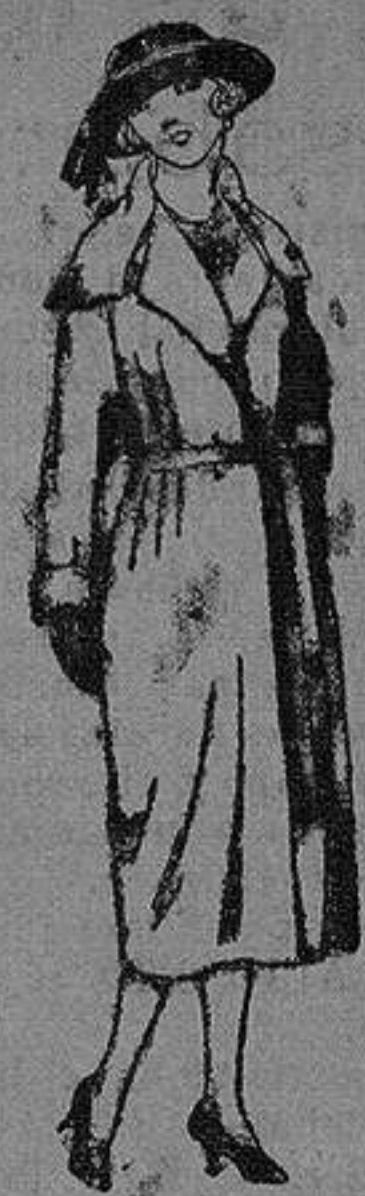
Abrigos de gamuzas, cheviot, etc., en negro, azul y color. de ptas 50 a 100