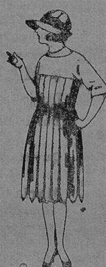
Vestidos de sarga inglesa, gabardina, etc., en azul y color. de ptas 55 a 95.