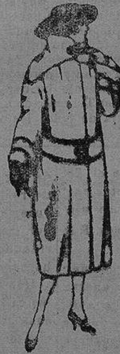
Abrigos de terciopelo de lana, ratina, etc., en negro, azul y color, adornos pespunte seda de ptas. 120 a 200