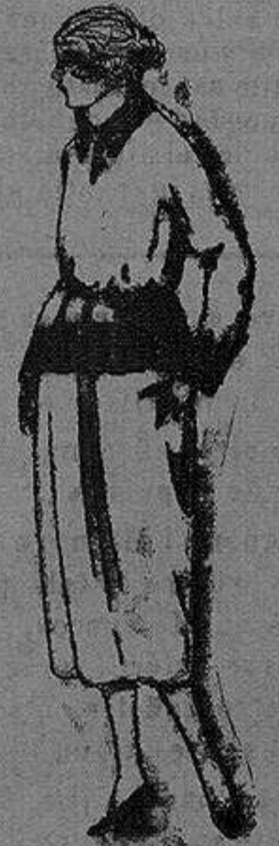
Paletos de punto de lana, hechos a mano. de ptas. 17.50 a 30