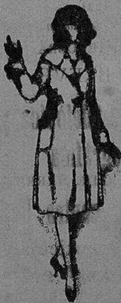
Abrigos de gamuzas, ratina, etc., en azul y color, para jovencitas de 12 a 15 años de ptas. 35 a 50

Ropas confeccionadas para Caballero, Señora, Niño y Niña