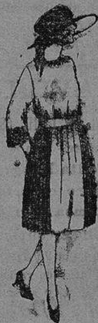
Vestidos de tambre, lanilla, etc., en azul y color, adornos bordados. de ptas. 65 a 90