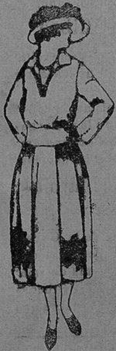
Vestidos de sarga inglesa, tambre, etc., en negro azul y color, adornos bordados a mano de ptas. 100 a 140