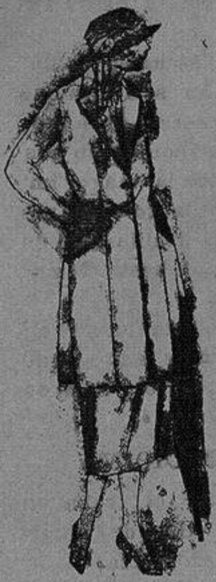
Trajos de sarga inglesa, haviot, en negro azul y color. de ptas 140 a 200.

Altamira, 2 :- Alicante :- Victoria, 1 Sucursales: Madrid, Barcelona, Almeria, Bilbao, Cadiz, Cartagena, Gijón, Granada, Málaga, Palma de Mallorca, Santander, Sevilla, Valencia, Valladolid, Zaragoza