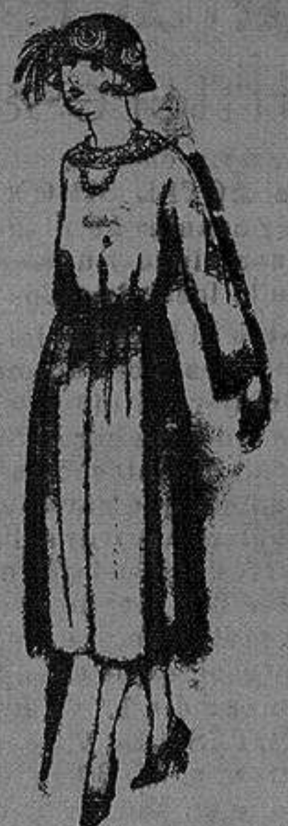
Vestidos de lanilla, gabardina etc., en negro, azul y color, adornos bordados. de ptas. 35 a 120