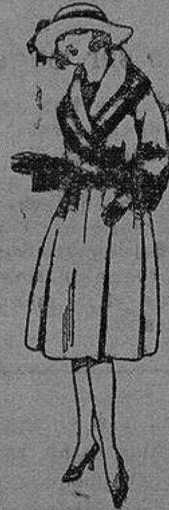
Abrigos de terciopelo de lana, gamuzas, etc., en negro, azul y color, para jovencitas de 12 a 15 años. de ptas. 35 a 95