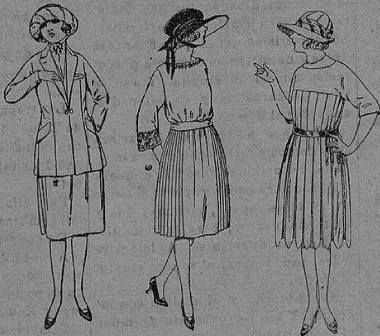
Trasjes de sarga inglesa, gabardina etc, en azul y color. de ptas. 85 a 100