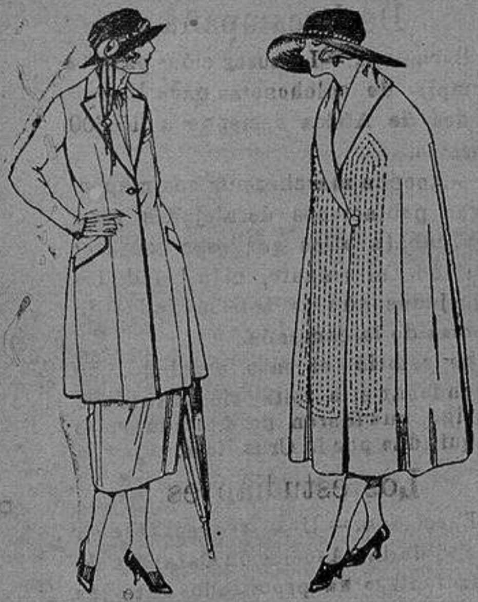
Trasjes de sarga inglesa, hevot, en negro azul y color. de pta 140 a 200.

Altamira, 2 :- Alicante :- Victoria, 1 Sucursales: Madrid, Barcelona, Almeria, Bilbao, Cadiz, Cartagena, Gijón, Granada, Málaga, Palma de Mallorca, Santander, Sevilla, Valencia, Valladolid, Zaragoza