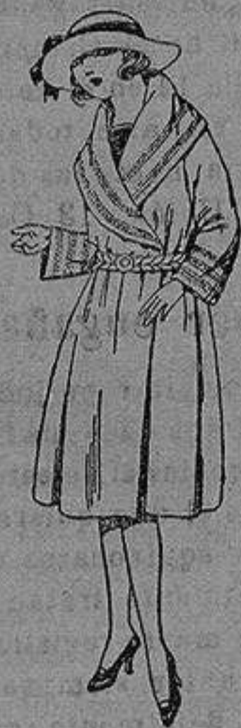
Abrigos de terciopelo de lana, gamuza, etc., en negro, azul y color, para jovencitas de 12 a 15 años. de ptas. 55 a 95