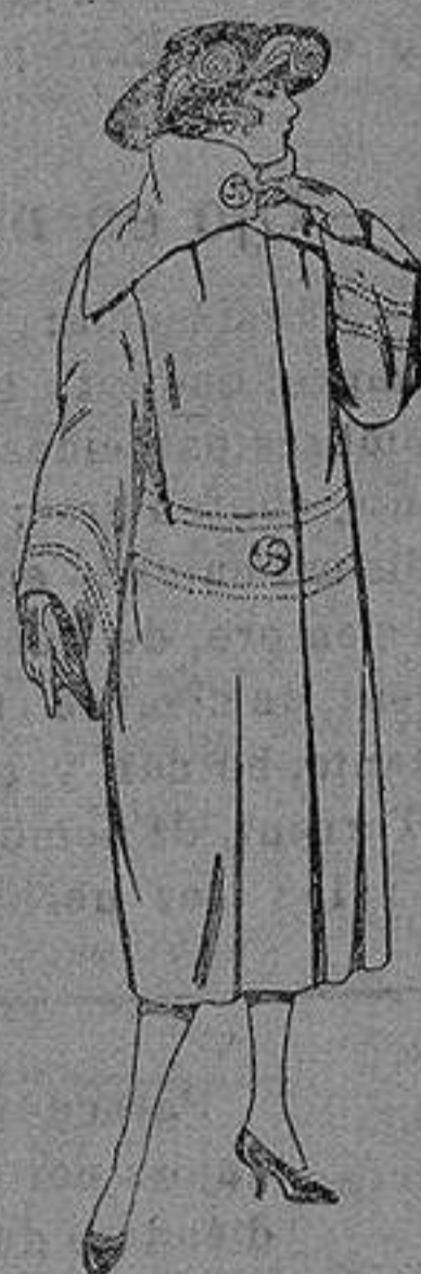
Abrigos de terciopelo de lana, ratina, etc., en negro, azul color, adornos pspunte seda de ptas. 120 a 200