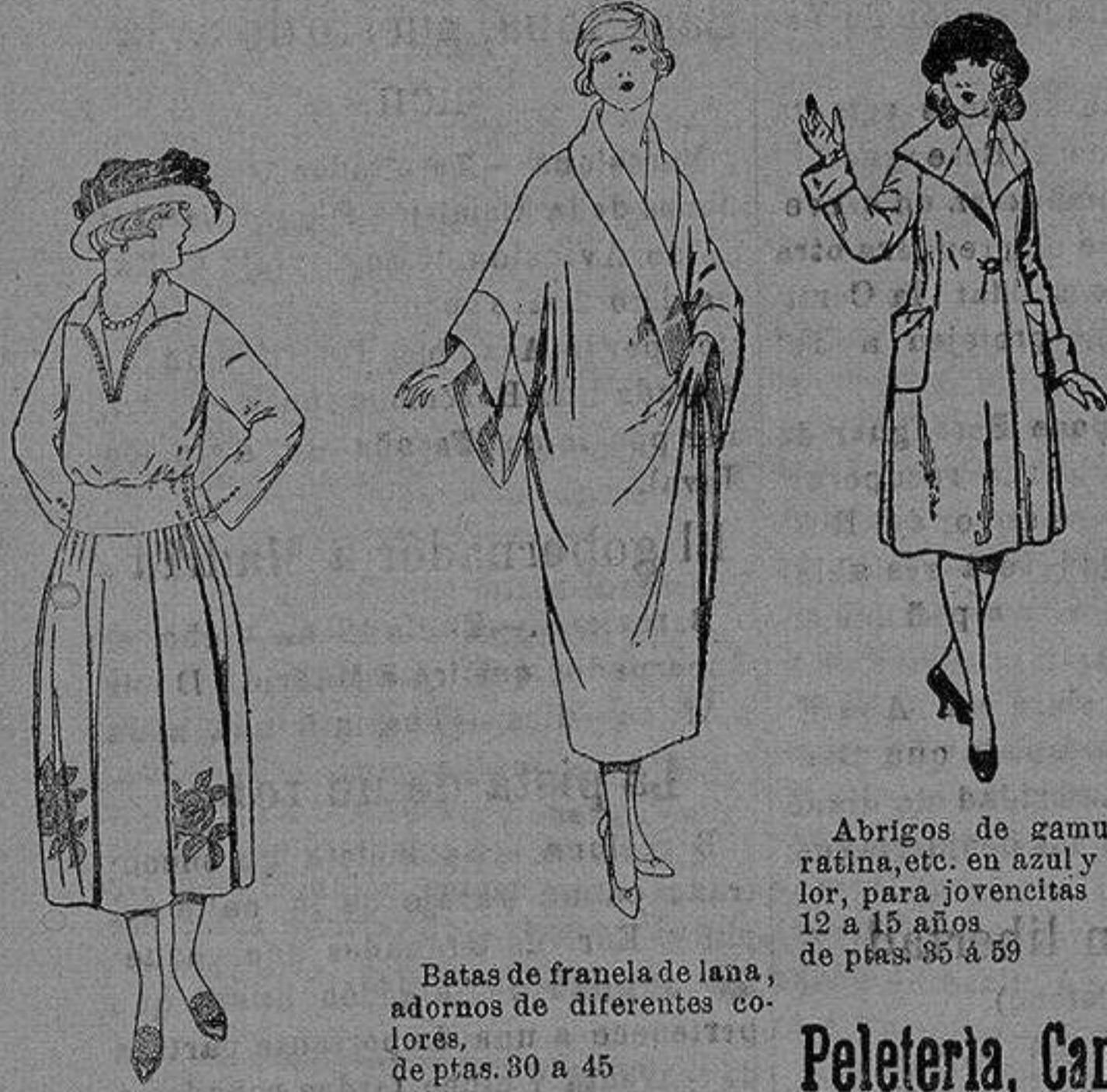
Abrigos de gamuza ratina, etc. en azul y color, para jovencitas de 12 a 15 años. de ptas. 85 a 99