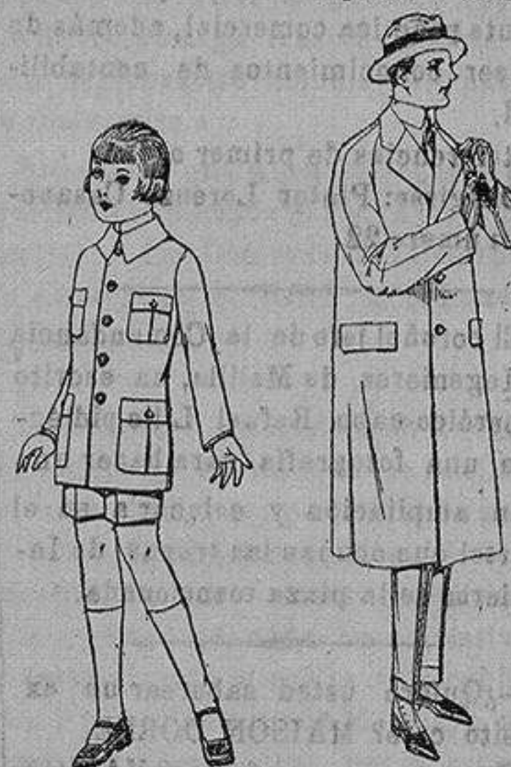
Trajes de patén modelo Sport, para niños de 4 a 9 años. de ptas. 22 a 35. Gabanes raglán de patén, melton, cheviot, con forro de seda o satén. de ptas. 60 a 160

Ropas confeccionadas para Caballero, Señora, Niño y Niña