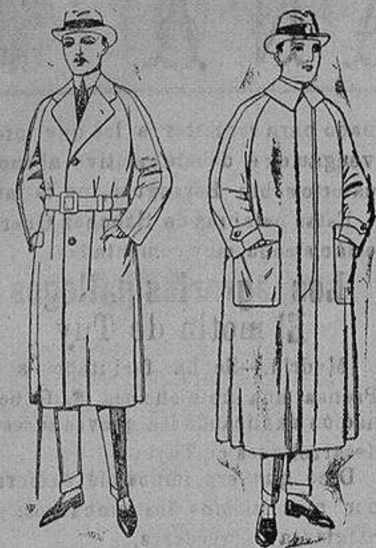
Gabanes raglán de patén, gamusa o color. de ptas. 75 a 200 Impermeables raglán en azul y colores. de ptas. 32 a 170

Sucursales: Madrid, Barcelona, Almeria, Bilbao, Cadiz, Cartagena, Gijón, Granada, Málaga, Palma de Mallorca, Santander, Sevilla, Valencia, Valladolid, Zaragoza