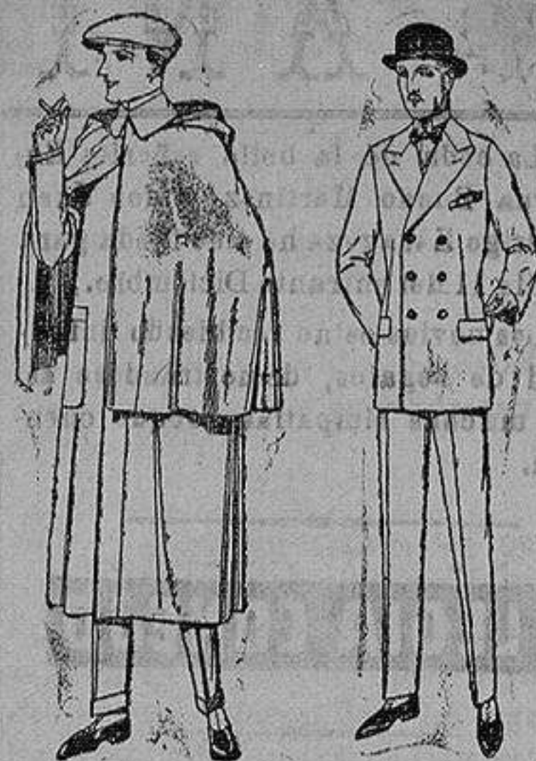
Impermeables mackferland en negro y azul de ptas. 85 a 157 Trajes de melton, cheviot, estambre, vicuña o jerga. de ptas. 50 a 175.