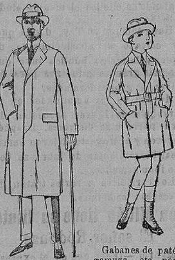
Gabanes de patén gamuza, etc. para niños y jovencitos de 10 a 16 años. de ptas. 30 a 7 Gabanes de cheviot gamuza o patén etcétera. de ptas. 45 a 140