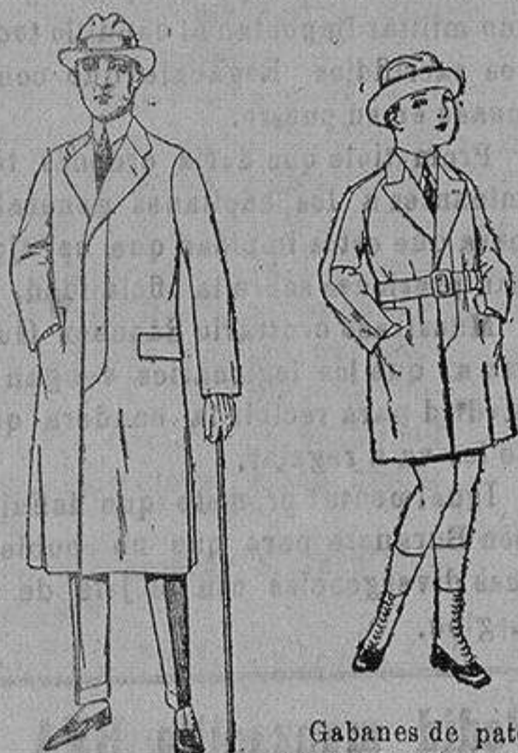
Gabanes de cheviot o gamusa o patén etcétera. de ptas. 45 a 140.