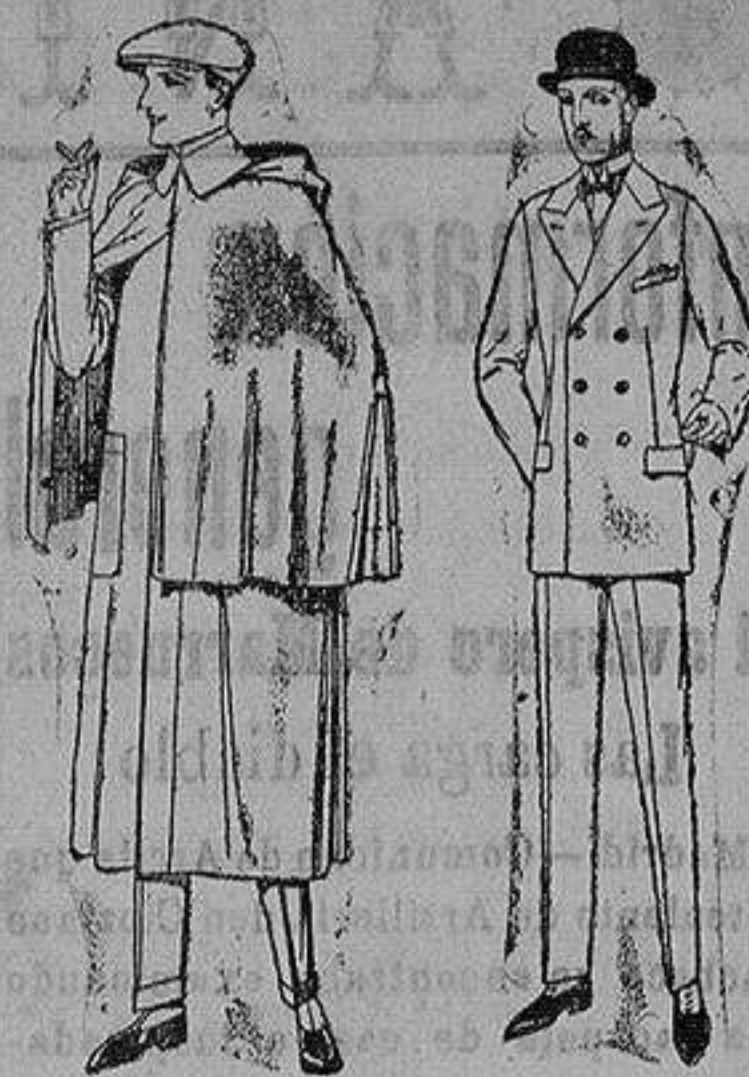
Impermeables mackferland en negro y azul de ptas. 85 a 157