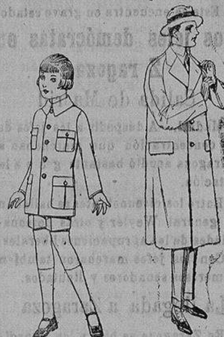
Trajes de patén modelo Sport, para niños de 4 a 9 años. de ptas. 22 a 35.