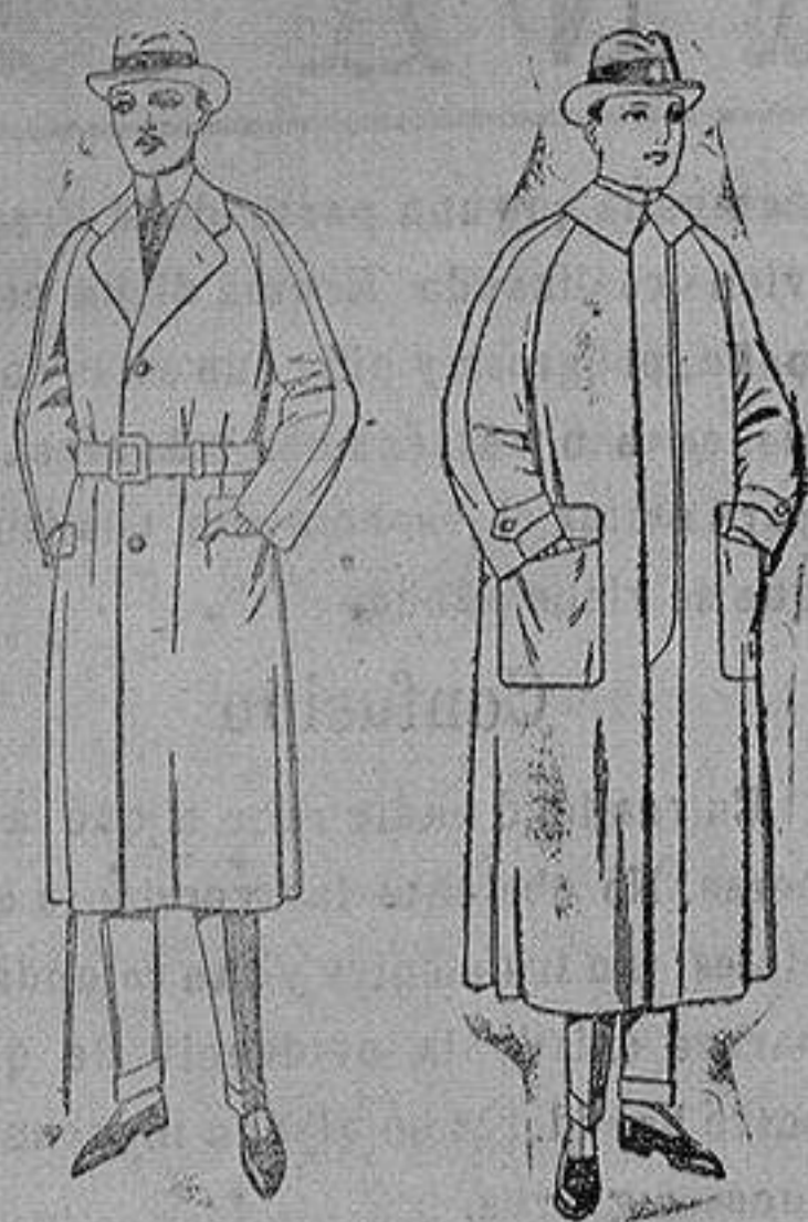
Gabanes raglán de patén, gamusa o cover. de ptas. 75 a 200 Impermeables raglán en azul y colores. de ptas. 32 a 170

Sucursales: Madrid, Barcelona, Almeria, Bilbao, Cadiz, Cartagena, Gijón, Granada, Málaga, Palma de Mallorca, Santander, Sevilla, Valencia, Valladolid, Zaragoza