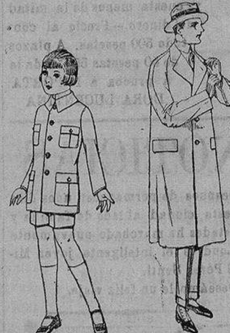
Trajes de patén modelo Sport, para niños de 4 a 9 años. de ptas. 22 a 35. Gabanes raglán de patén, melitón, cheviot, con forro de seda o satén. de ptas. 60 a 160

Ropas confeccionadas para Caballero, Señora, Niño y Niña