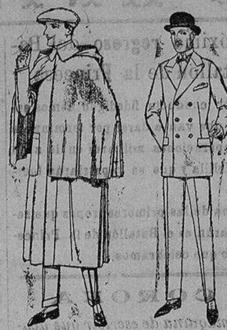
Impermeables mack-tón, cheviot, azul de ptas. 85 a 157 Trajes de melitón, cheviot, estambre, vicuña o jerga. de ptas. 50 a 175.