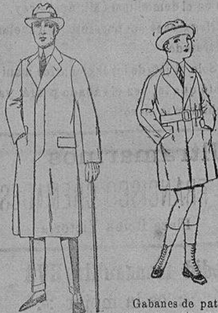
Gabanes de patén gamusa, etc. para niños y jovencitos de 10 a 16 años. de ptas. 30 a 7 Gabanes de cheviot, gamusa o patén etcétera. de ptas. 45 a 140.