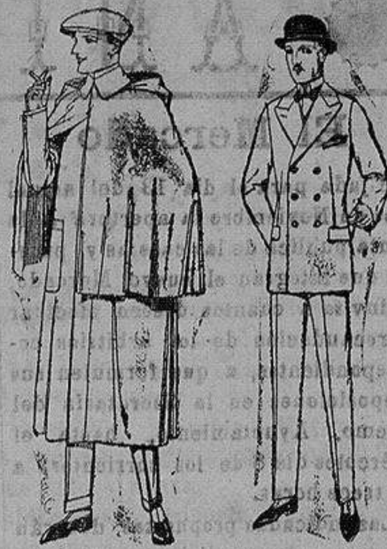
Impermeables mack-fortland en negro y azul de ptas. 85 a 157 Trajes de melton, cheviot, estambre, vicuña o jerga. de ptas. 50 a 175