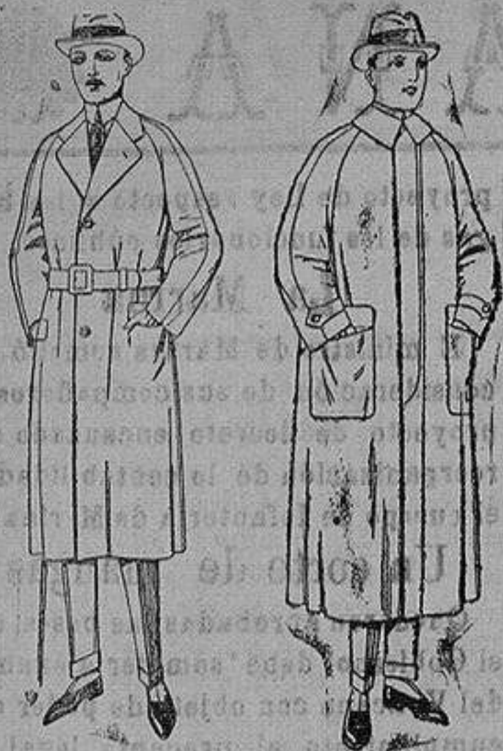
Gabanes raglánde patén, gamusa o co-ver. de ptas. 75 a 200 Impermeables raglánde en azul y colores. de ptas. 32 a 170

Altamira, 2 :- Alicante :- Victoria, 1 Sucursales: Madrid, Barcelona, Almeria, Bilbao, Cadiz, Cartagena, Gijón, Granada, Málaga, Palma de Mallorca, Santander, Sevilla, Valencia, Valladolid, Zaragoza