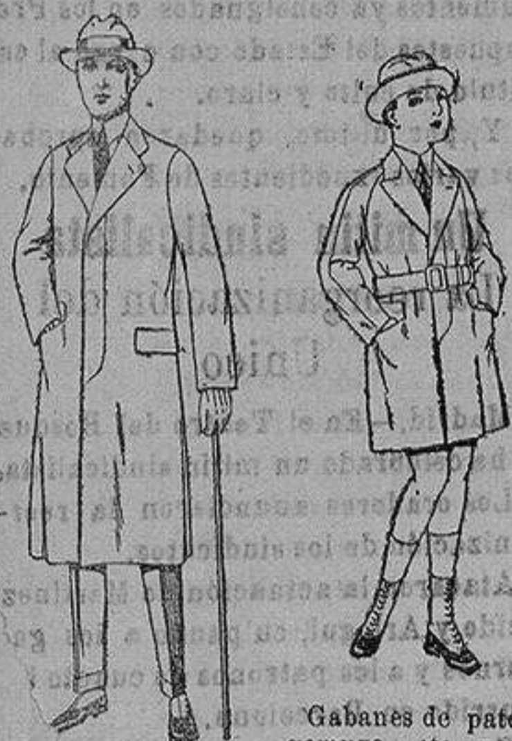
Gabanes de patén gamusa, etc. para niños y jovencitos de 10 a 16 años. de ptas. 30 a 75 Trajes de cheviot o patén de ptas. 45 a 140