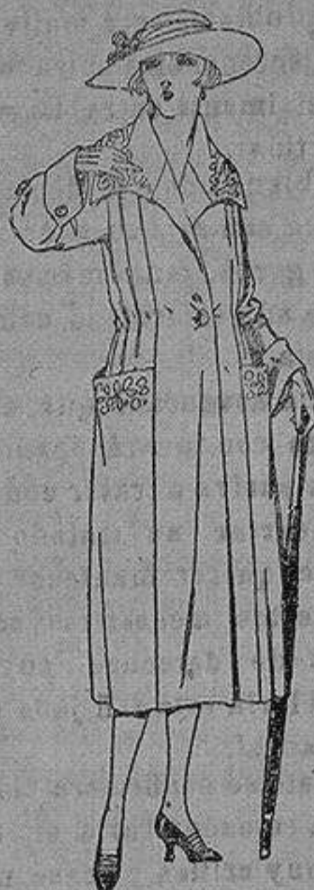
Abrigos de pañete, gamuza, etc. en azul y color, adornos bordados. de ptas. 70 a 120

Ropas confeccionadas para Caballero, Señora, Niño y Niña Peletería, Camisería Géneros de punto Corbatería, Guantería, Sombrerería, Zapatería, Paraguas Bastones y Artículos de Viaje