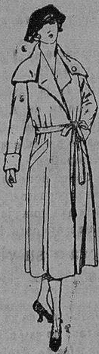
Abrigos de seda impermeables. de ptas. 180 a 225