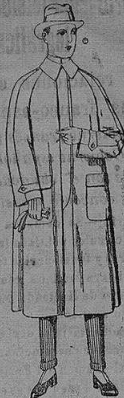
Impermeables raglán, en azul y colores. de ptas. 40 a 170