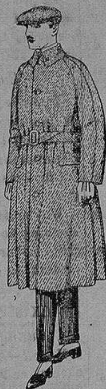
Gabanes de patén, Cheviot cover. de ptas. 90 a 160