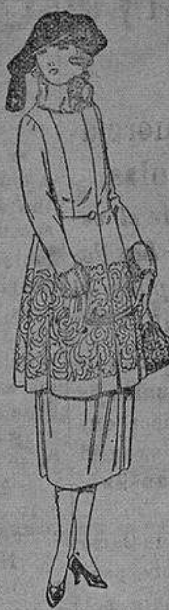
Trajes de gamuza, adornos bordados y con piel, en negro, azul y color de ptas. 180 a 230