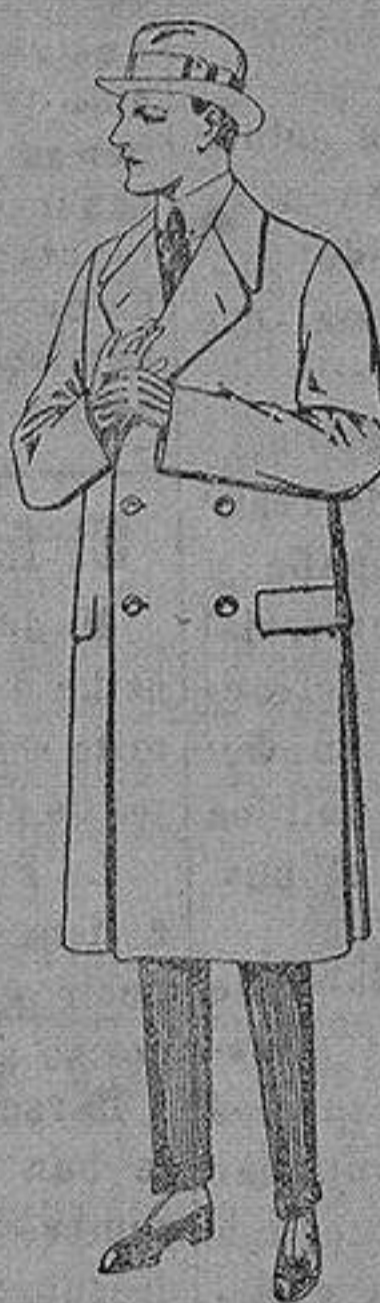
Gabanes de patén, gamuza o cover. de ptas. 60 a 200