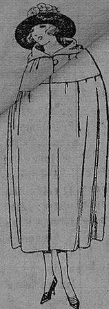
Capas de gabardina, terciopelo de lana, etc. diferentes colores. de ptas 18 a 40