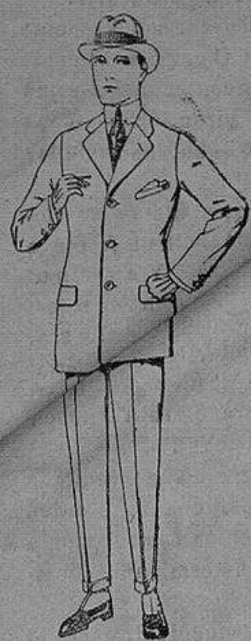
Trajes de cheviot, patén etc de ptas. 88 a 185

Sucursales: Madrid, Barcelona, Almeria, Bilbao, Cadiz, Cartagena, Gijón, Granada, Málaga, Palma de Mallorca, Santander, Sevilla, Valencia, Valladolid, Zaragoza