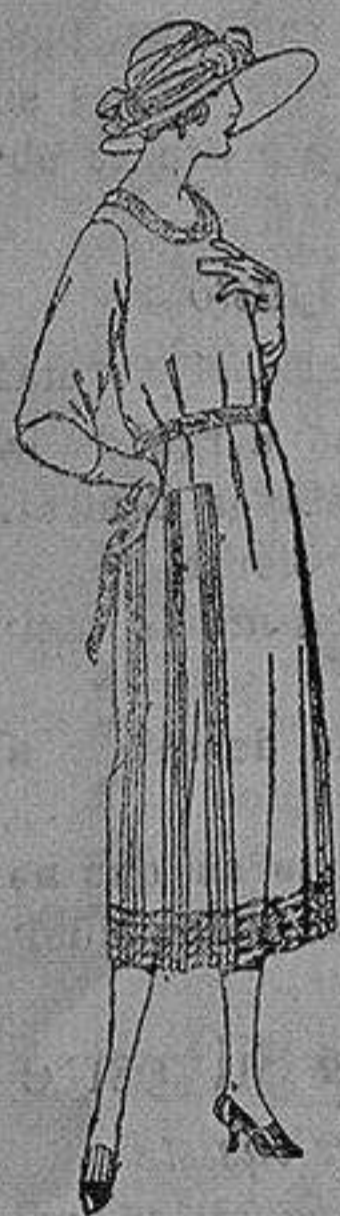
Vestido de estambre, tricelina, gabardina, etc. en negro azul y color, adornos bordados. de ptas. 110 a 150