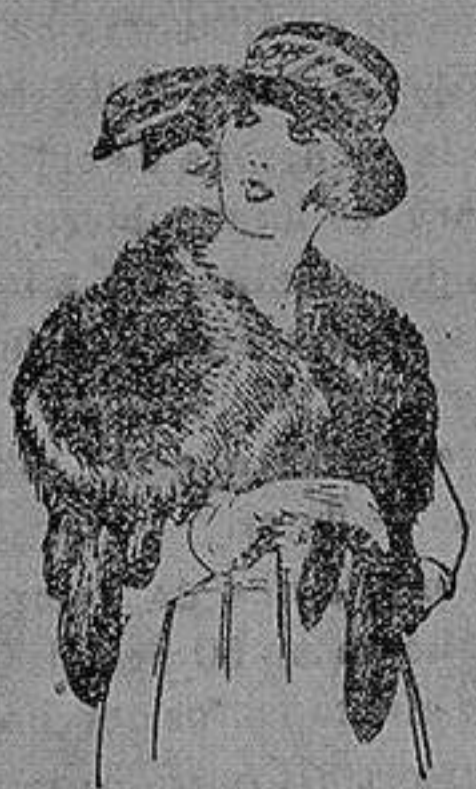
Cuello piel Renardina en blanco, marrón, gris y negro. de ptas. 18 a 40