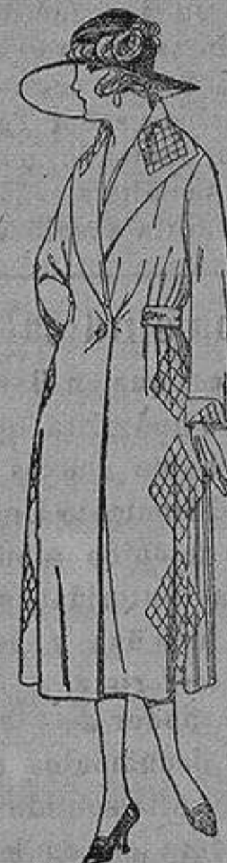
Abrigos de gamuza, ratina, etc. en negro, azul y color, adornos y respuntes seda de ptas. 65 a 110