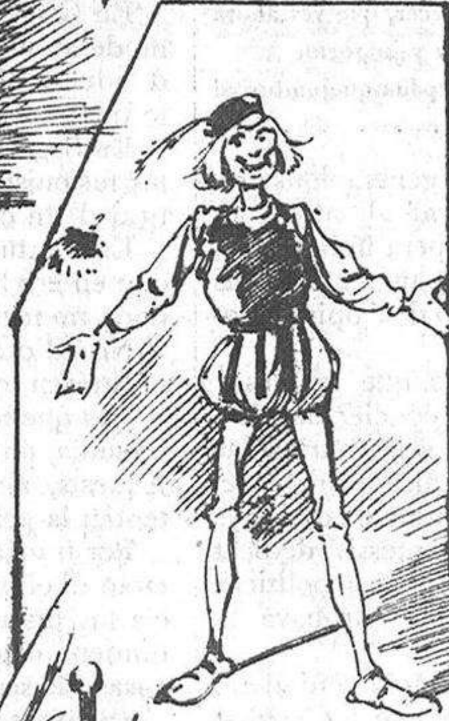
Los actors d' afició.