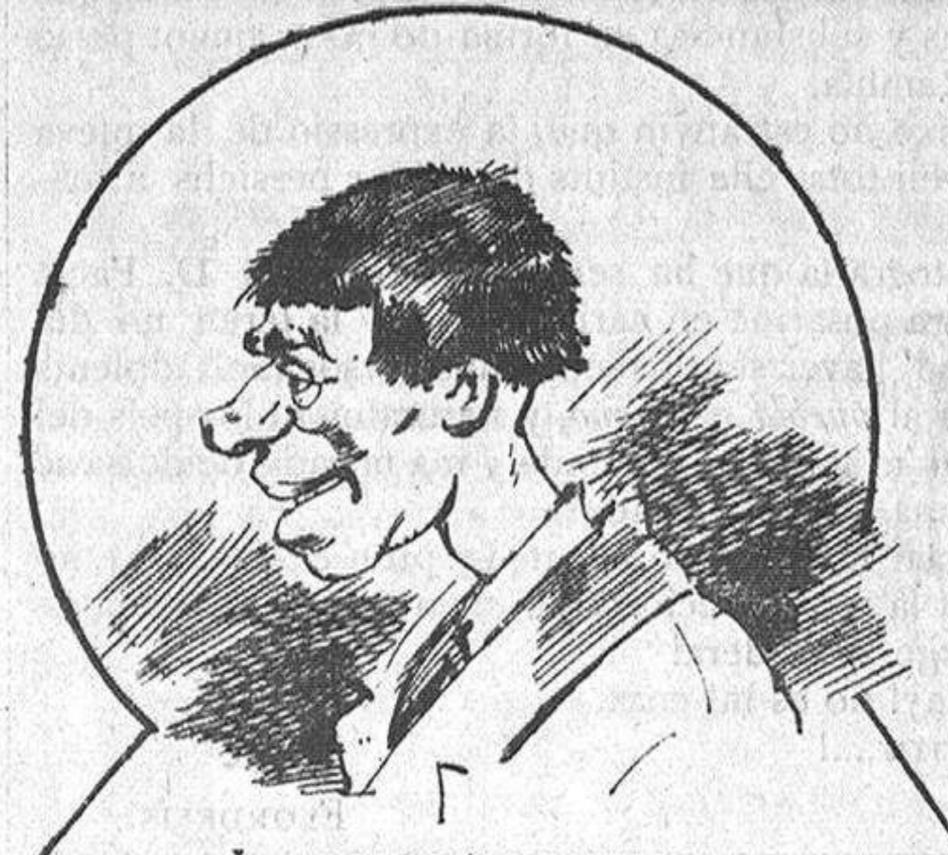
Los que portan perruca creyent que no se 'ls coneix