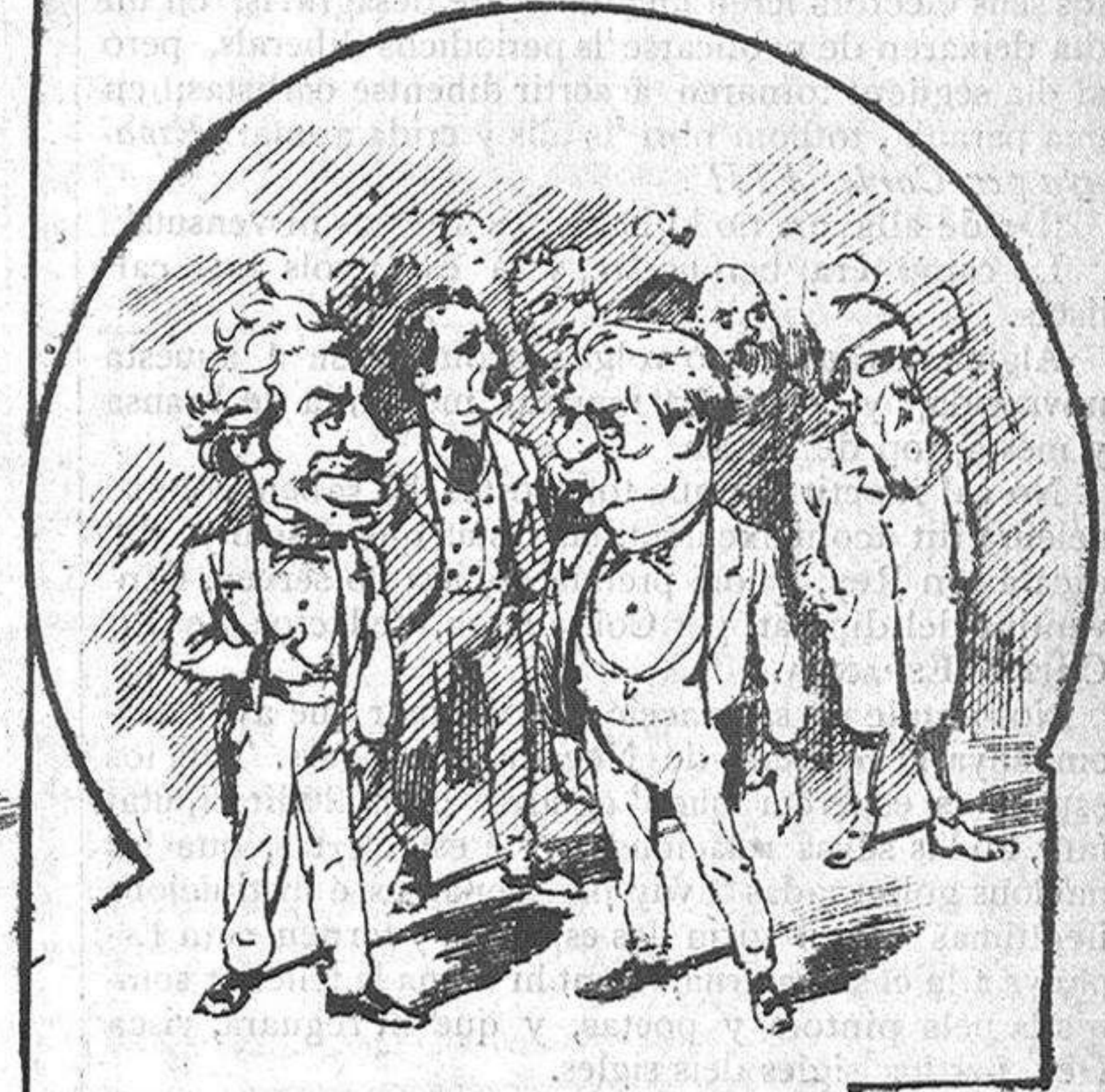
Los que creuhen ab aquestos.