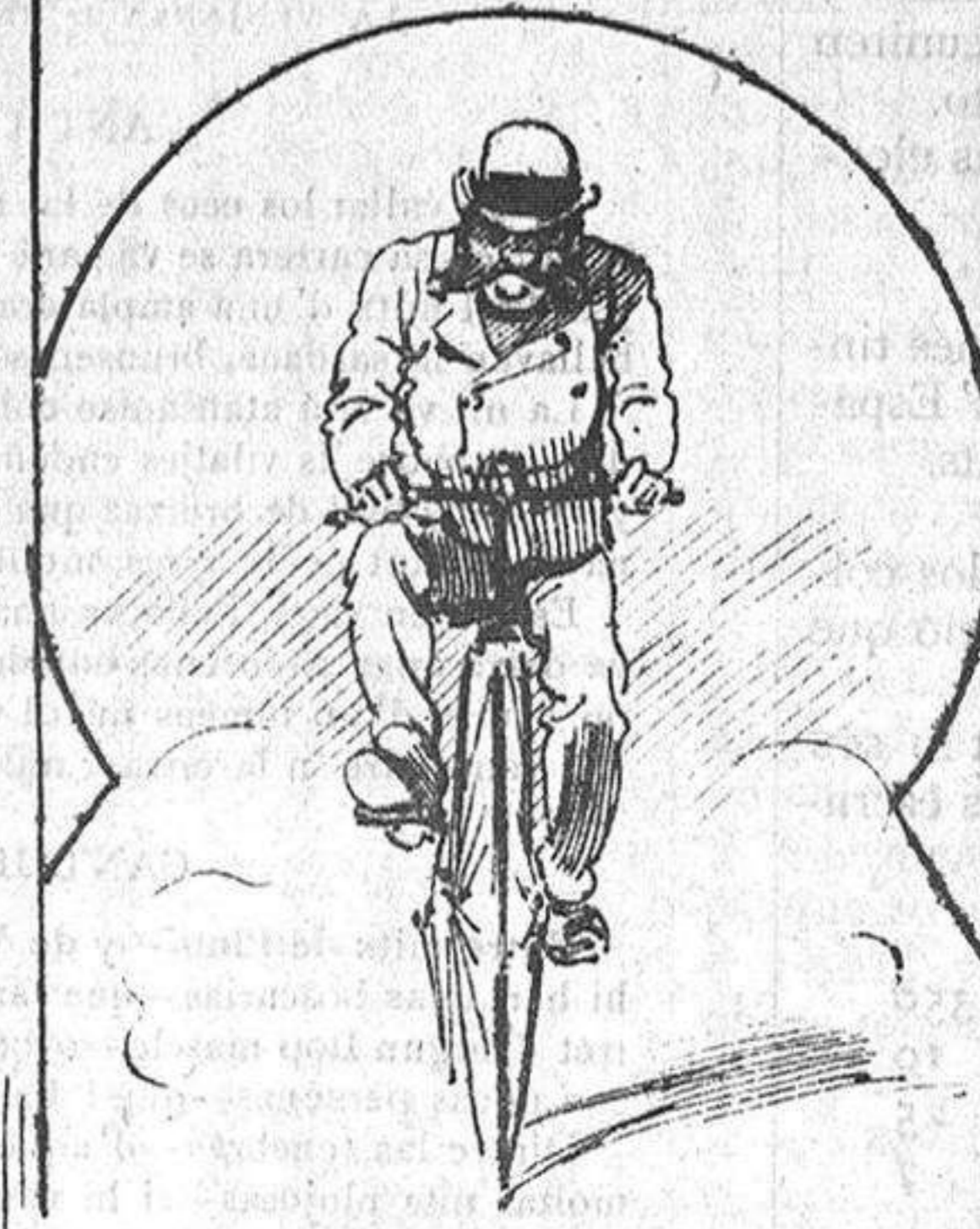
Los que van en bicicleta.