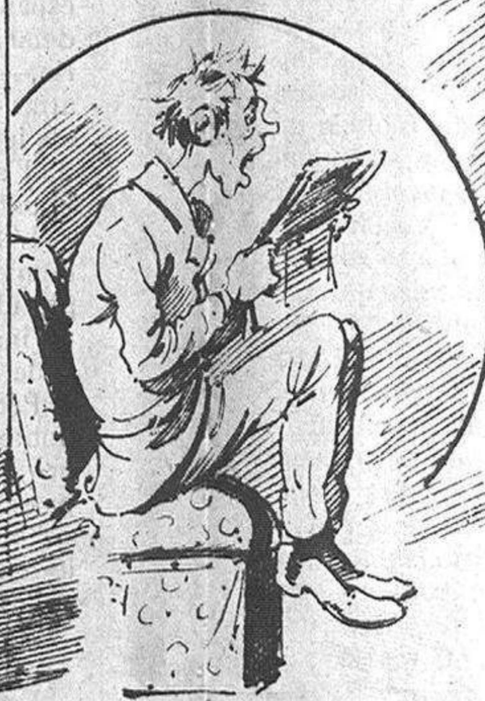
Los que sufreixen lleigint lo folletí de La Correspondencia.