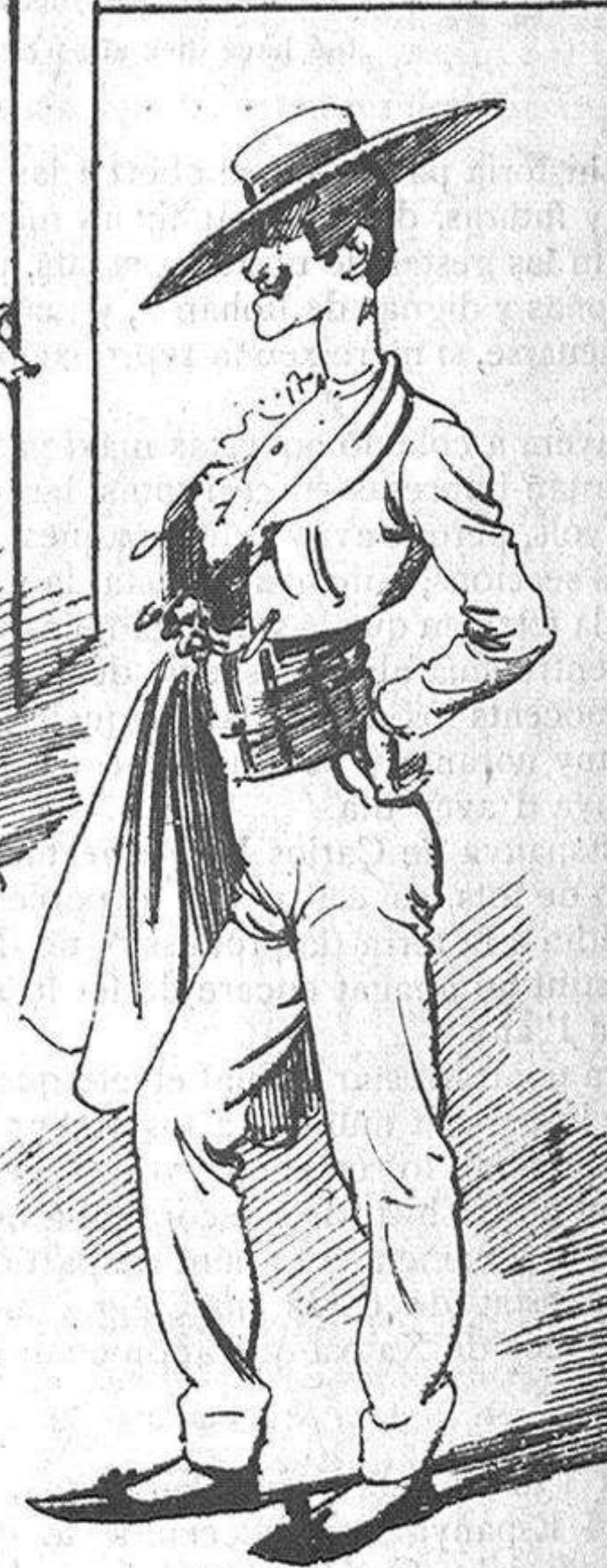
Los toreros de Beneficencia.