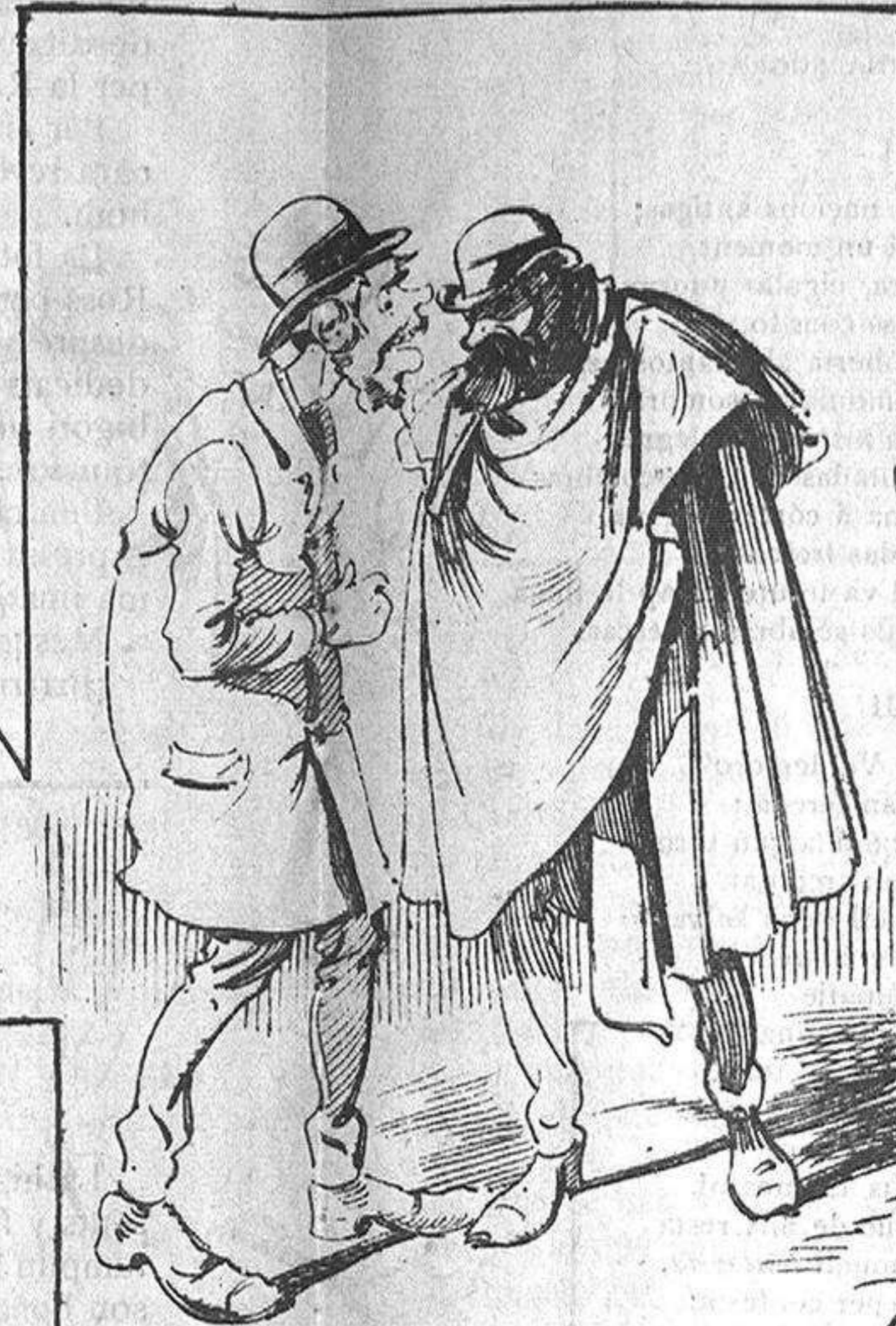
Los que conspiran á favor de 'n Zorrilla.