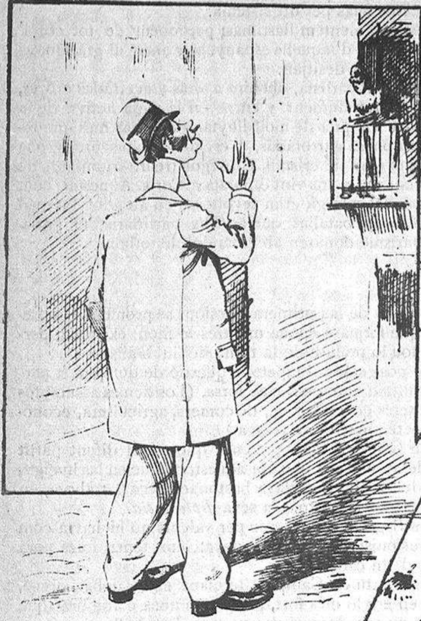
Los que fan l' os desde 'l carrer.