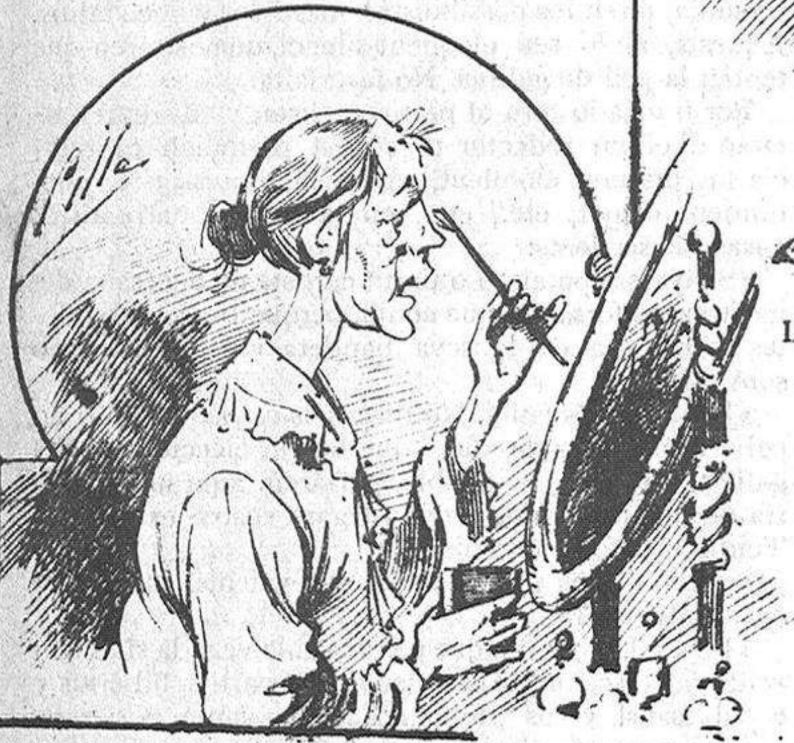
Las lletxas que 's pintan.