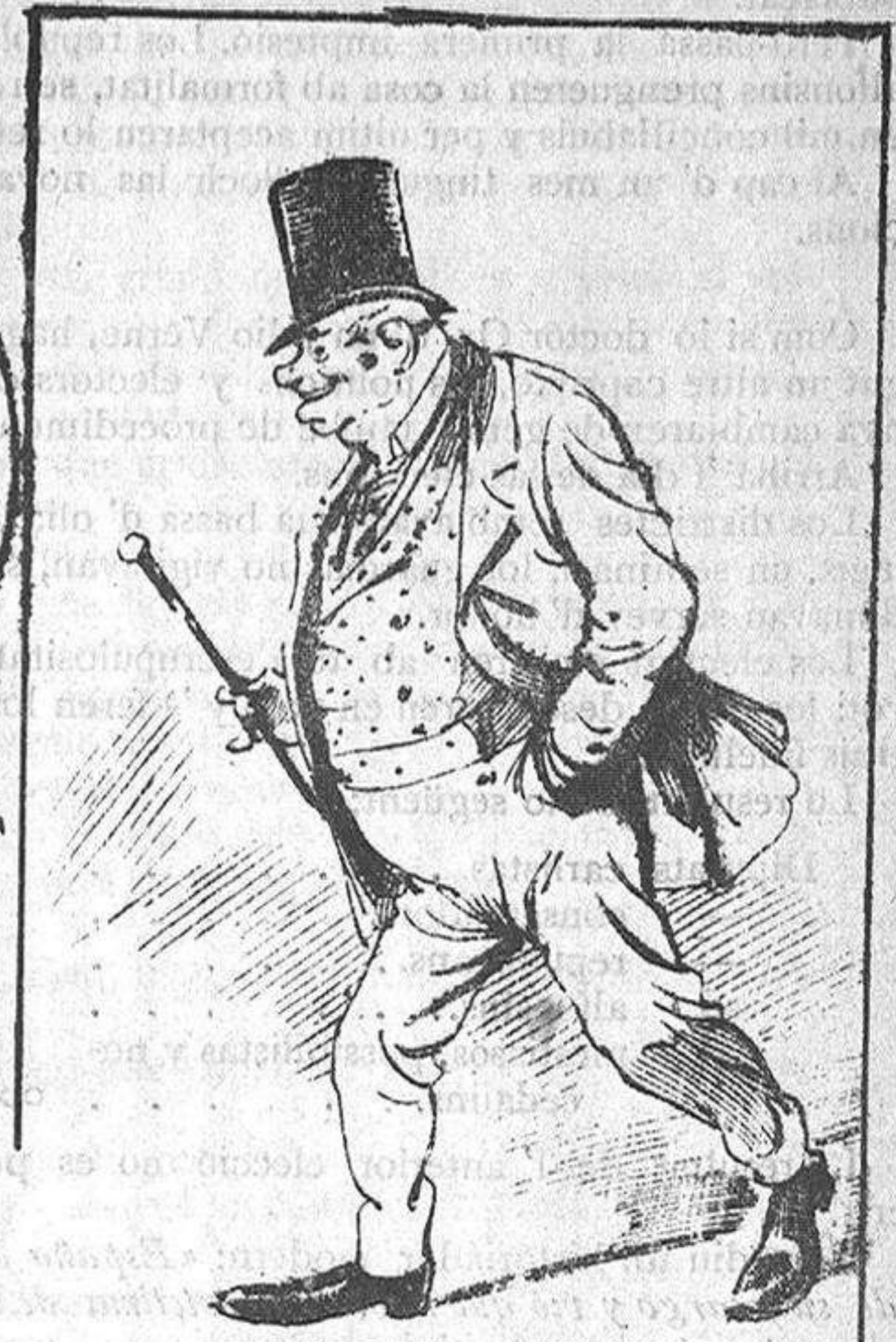
Los Tenorios d' edat.