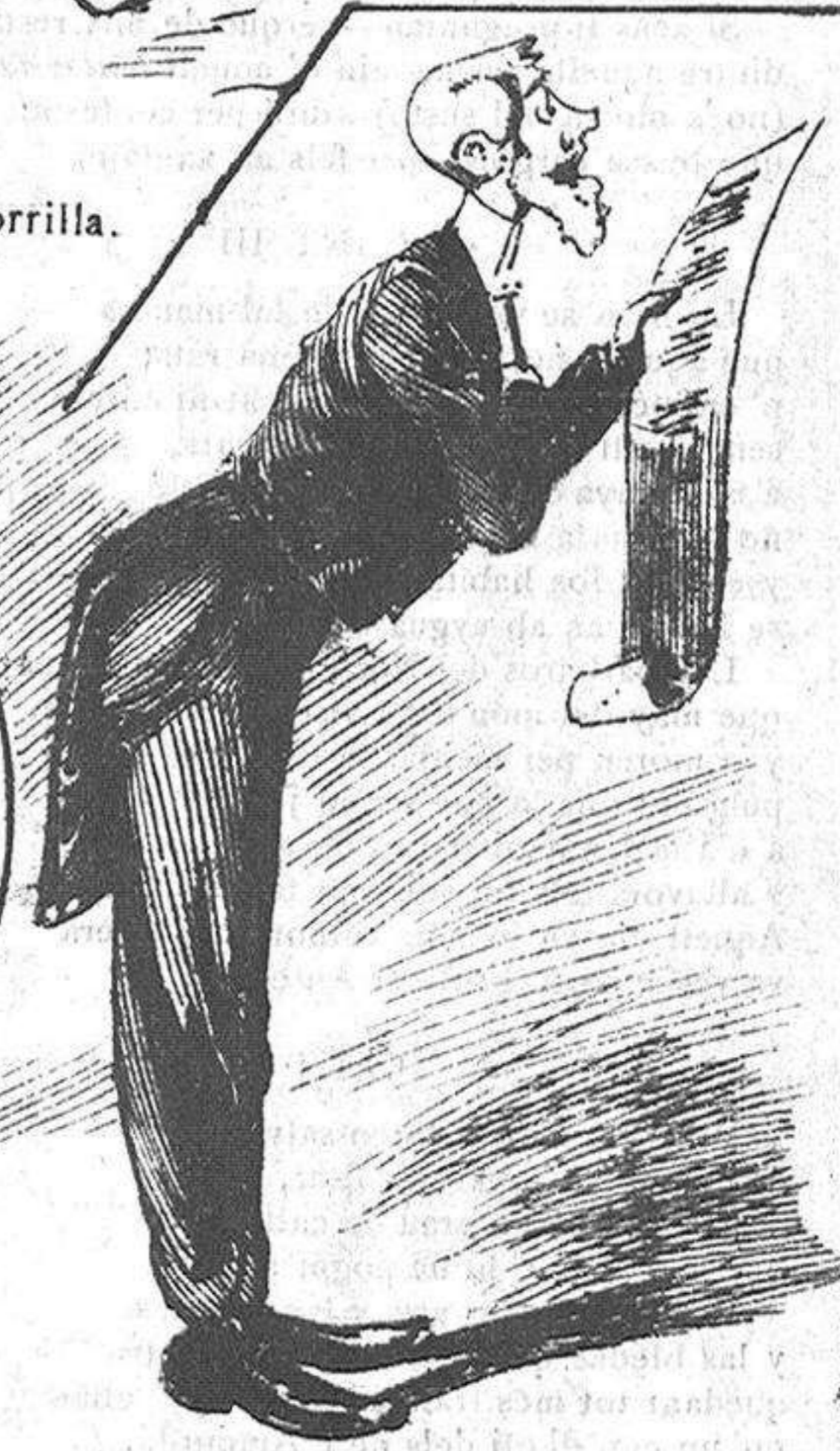
Los cantants de saló.