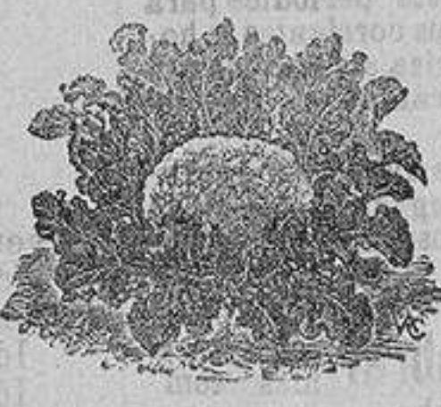
Brócoli blanco Mammoth

SEMILLAS DE HORTALIZA de las que mejor resultan en esta país: acelga, berza, borraja, brócoli, cardo, cebolla, coliflor (pella), escarola, guisantes, lechuga, rabanos, zanahoria, puerro y otras muchas variedades. Se venden en paquetes, desde dos reales en adelante.