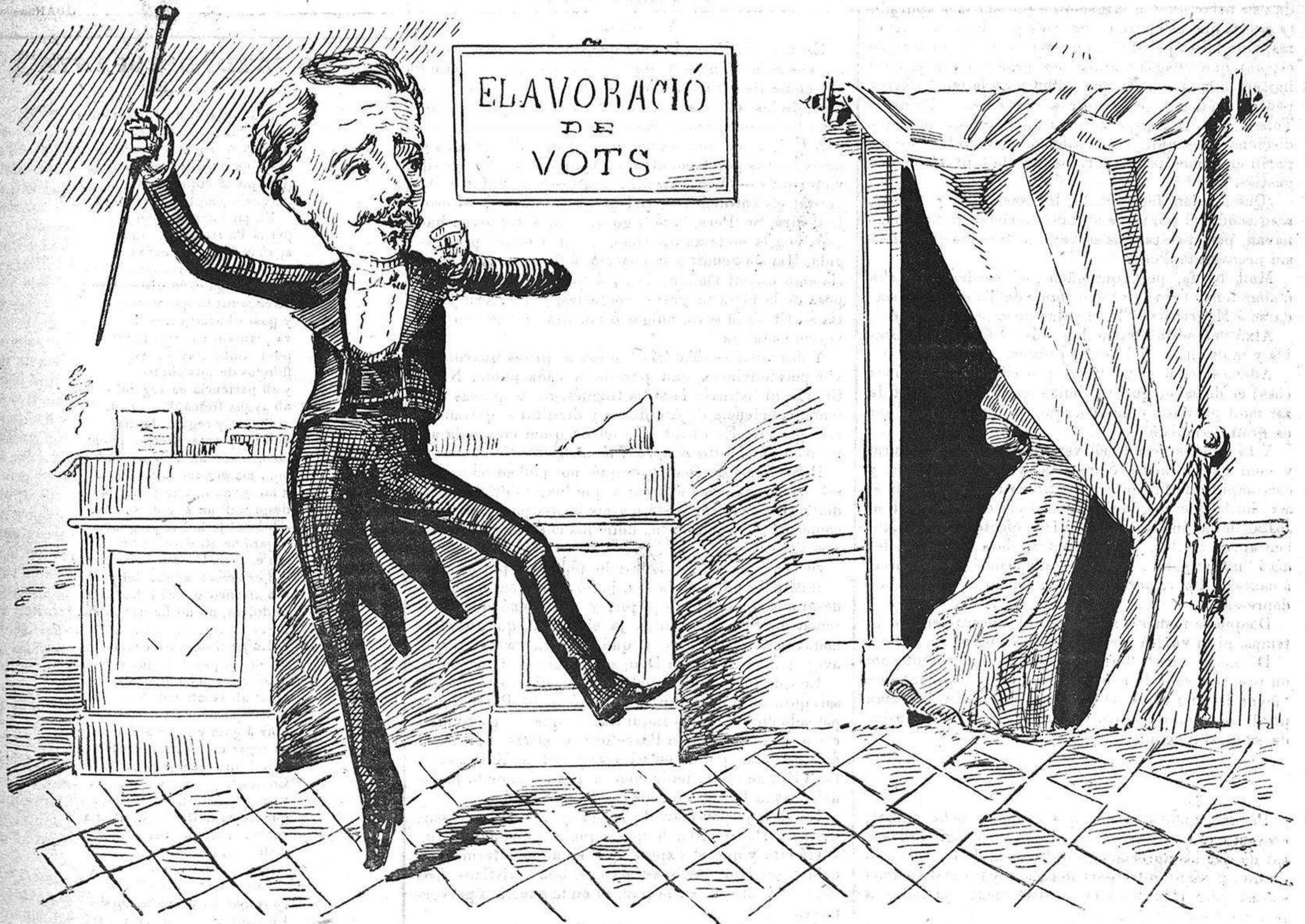
— ¡Arri allá, trasto! Donya Sinceritat no hi cab entre nosaltres. ¡No faltaba sino que aquesta dona 's volgués posar las calsas..... municipals....!