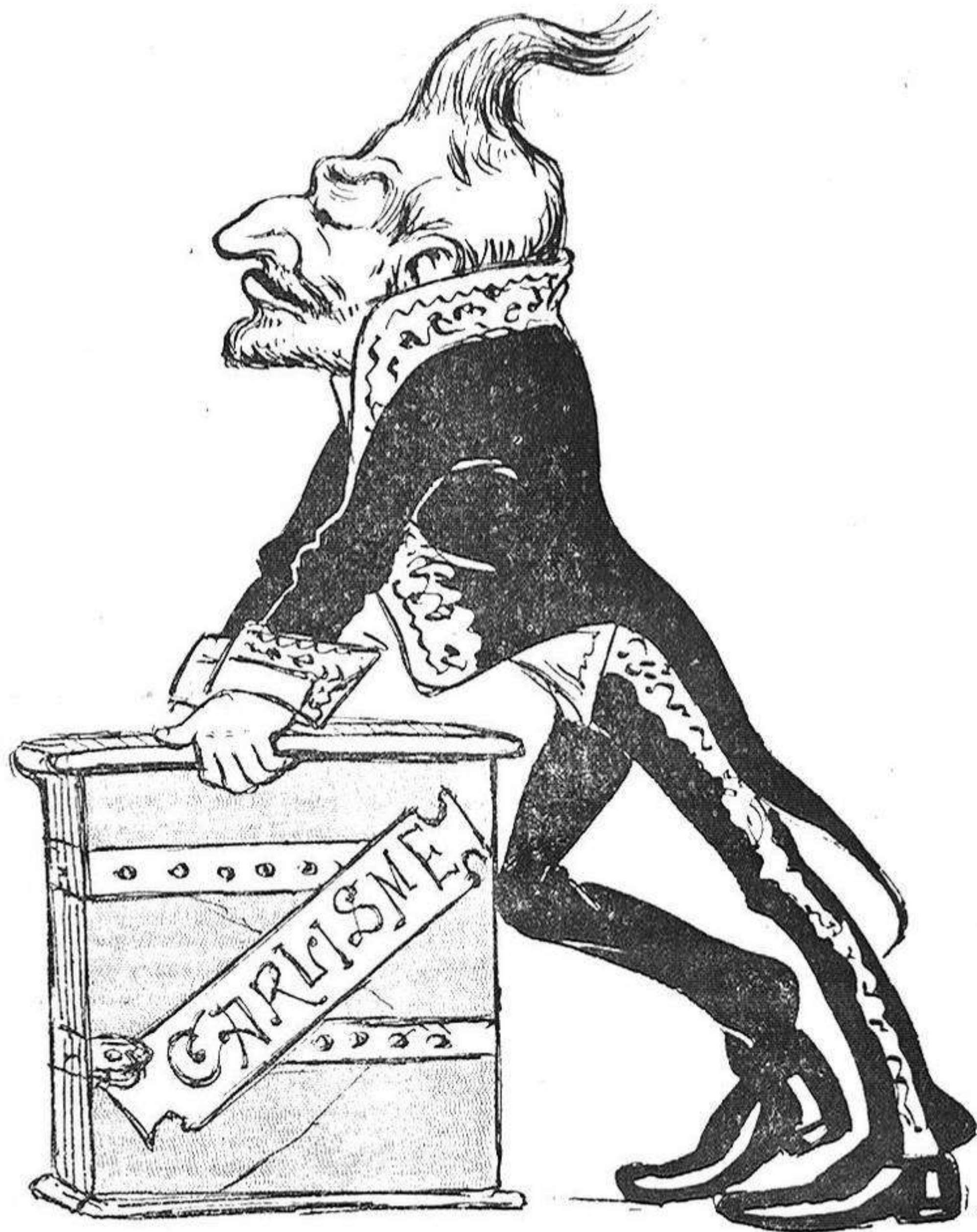
Al carlisme 'l tinch aquí tancat com un ratolí.

Establiment Tipogràfic, Casanova, 13; Barcelona.