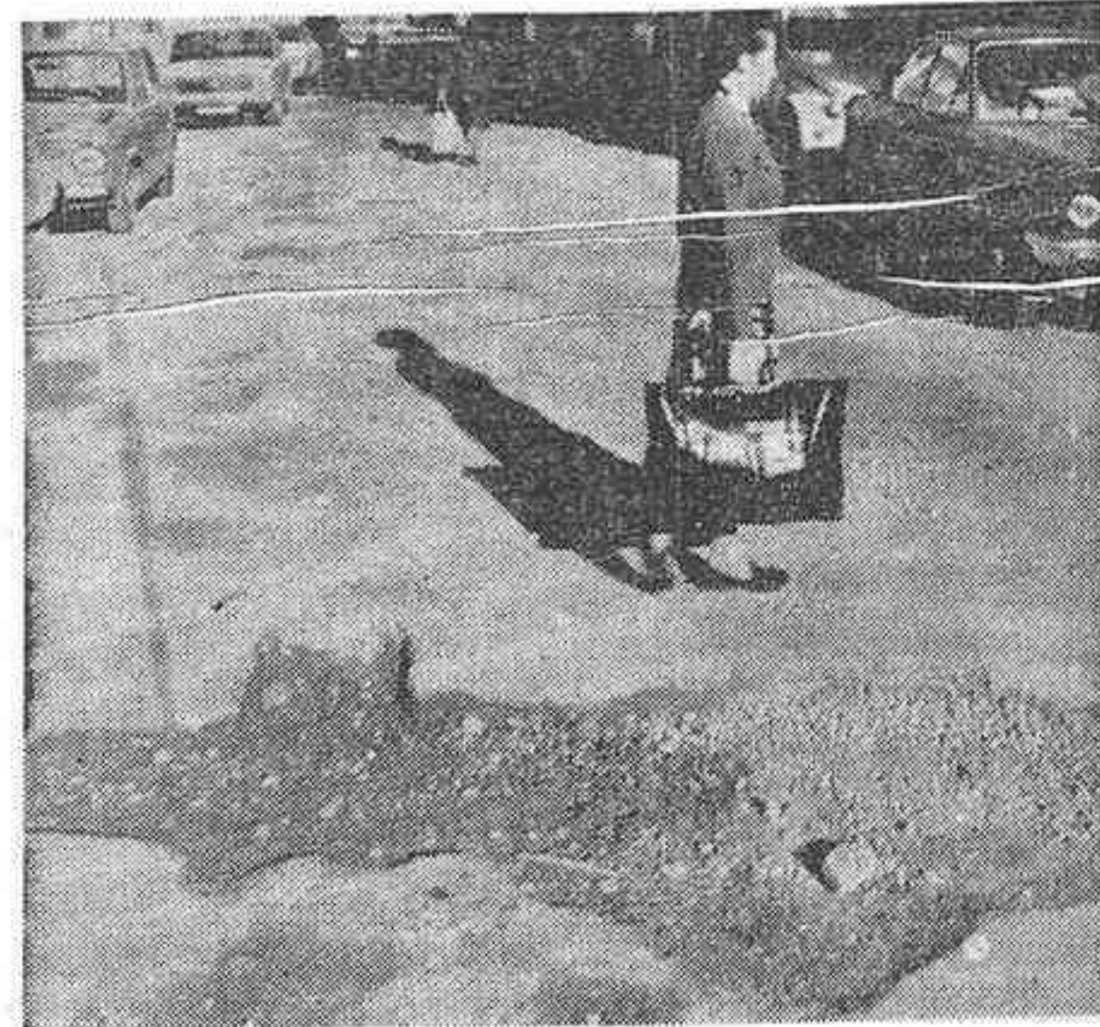
Calle Alcalde Tárrega. El proyecto técnico de reparación de su deteriorado pavimento fue aprobado ayer, pero el reparto de contribuciones especiales quedó sobre la mesa, tras un apasionante debate

Sustitución de calzadas, aceras, alcantarillado y bocas de riego e incendio en la calle Al-