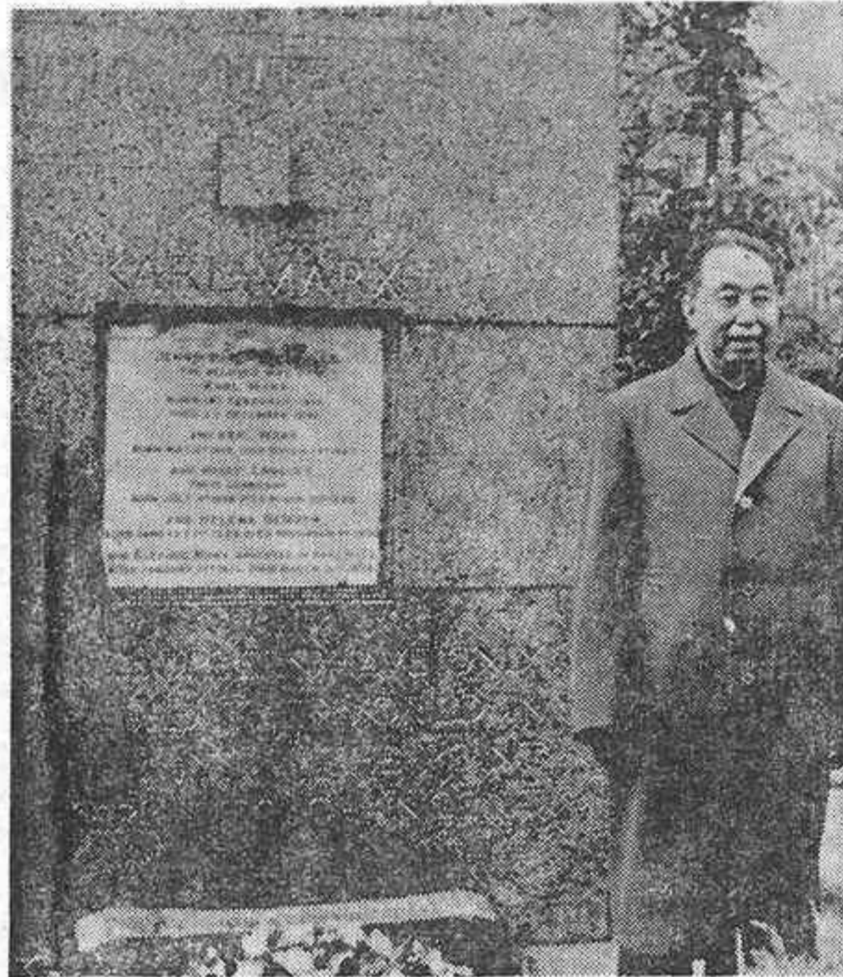
Hua Guofeng junto al monumento funerario a Marx en Londres.

La visita del número uno chino a Europa Occidental finalizó sin resultados espectaculares pero tampoco fue un viaje perdido. La razón principal de este viaje, sin precedentes en el historial de los dirigentes chinos, se encuentra en una frase pronunciada hace algunos meses por el número 2 de Pekín, el ambicioso Deng Xiaoping: «Hemos perdido toda una generación de técnicos y científicos». Este interés privilegiado de Pekín por la ciencia moderna no