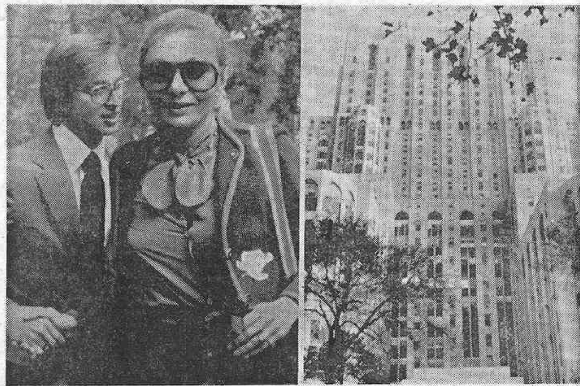
El gigantesco aspecto del edificio donde está alojado el Sha. Farah Diba con una flor en la mano, es saludada por uno de los periodistas que hacen guardia a la puerta del hospital.

El internamiento del Sha en un hospital de Nueva York, motivo de crisis política y de discusiones médicas