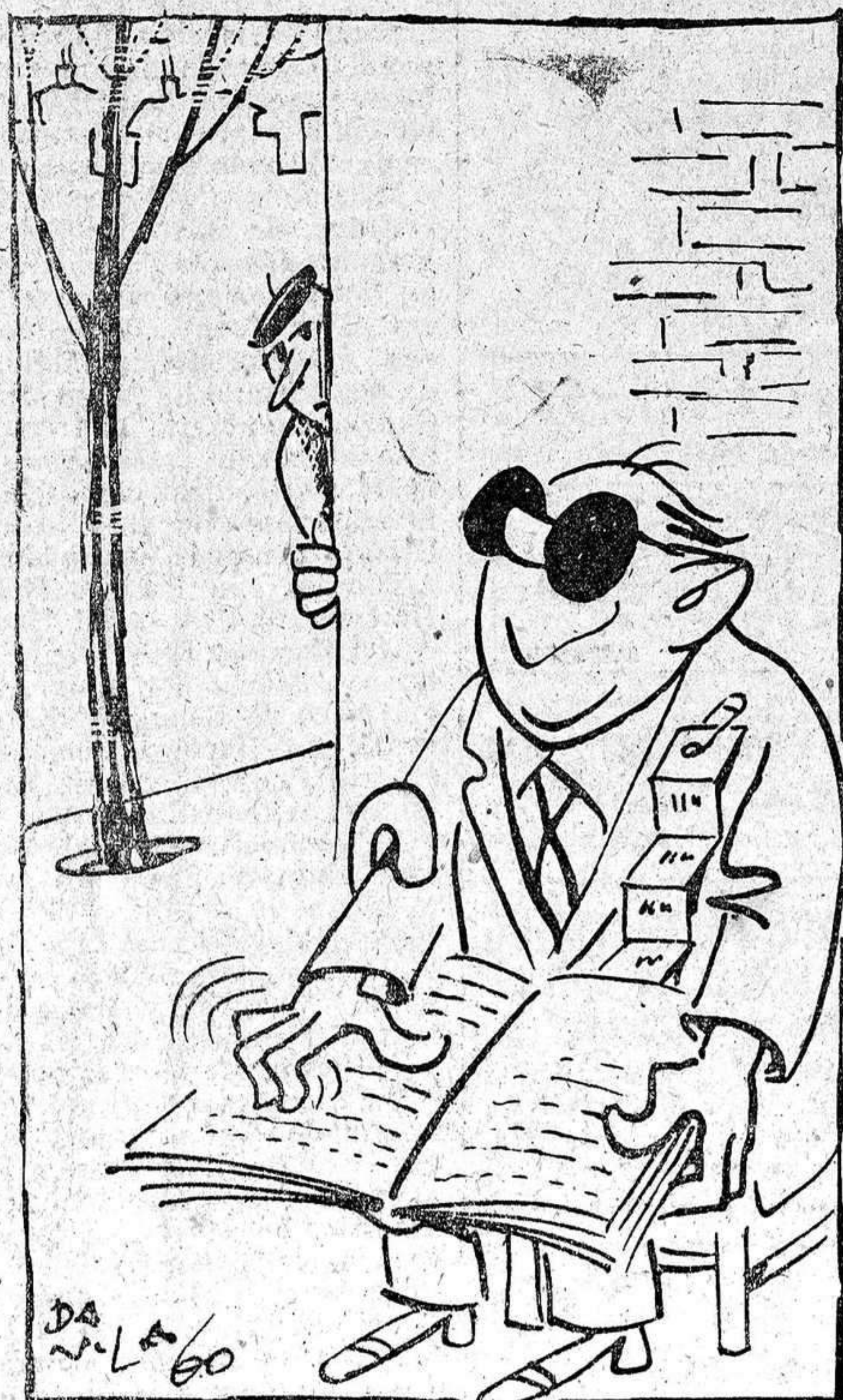
Analfabeto: Hay quien ve más que tú