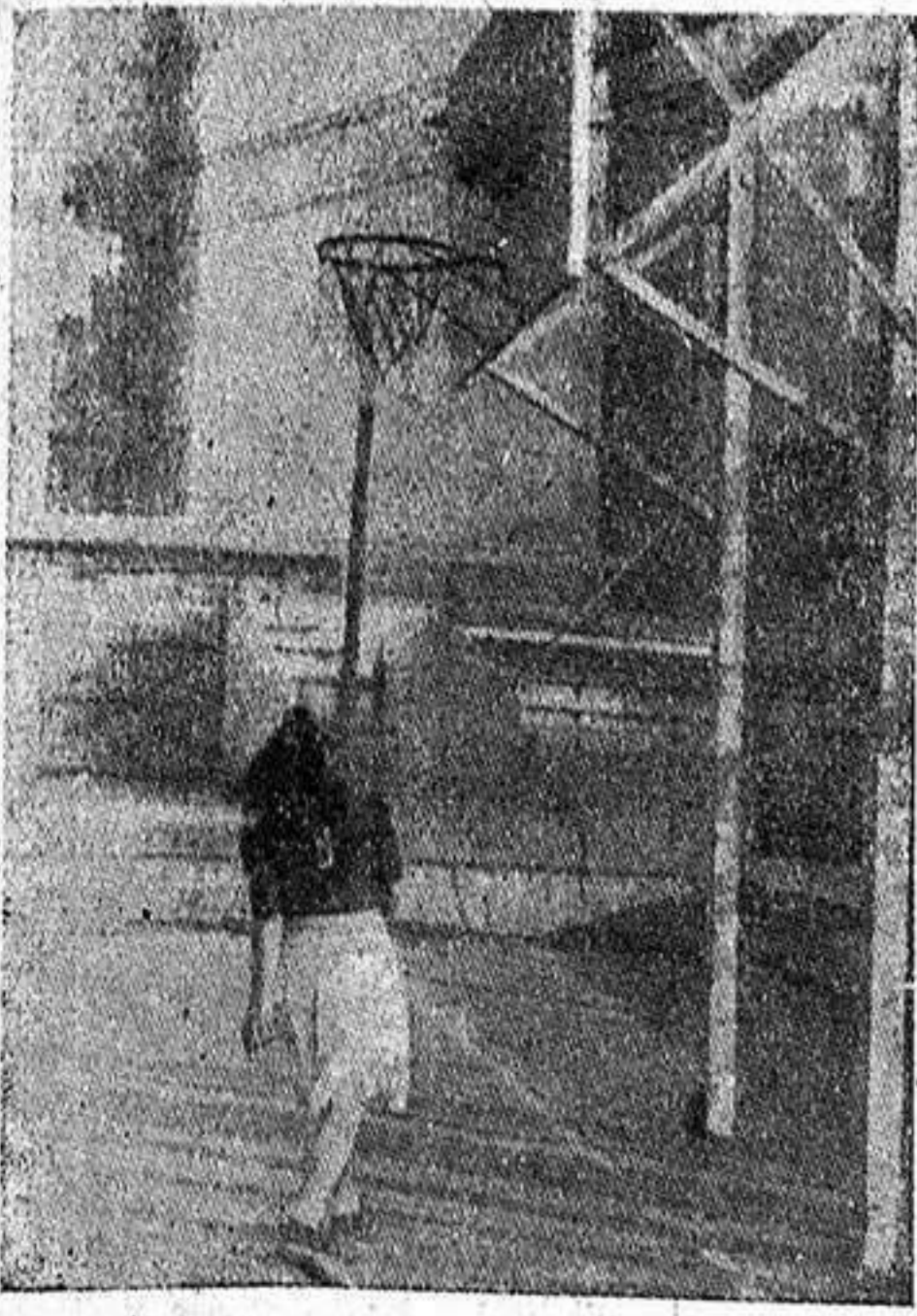
Una deportista de nuestros equipos de baloncesto perfeccionándose en el tiro al cesto.