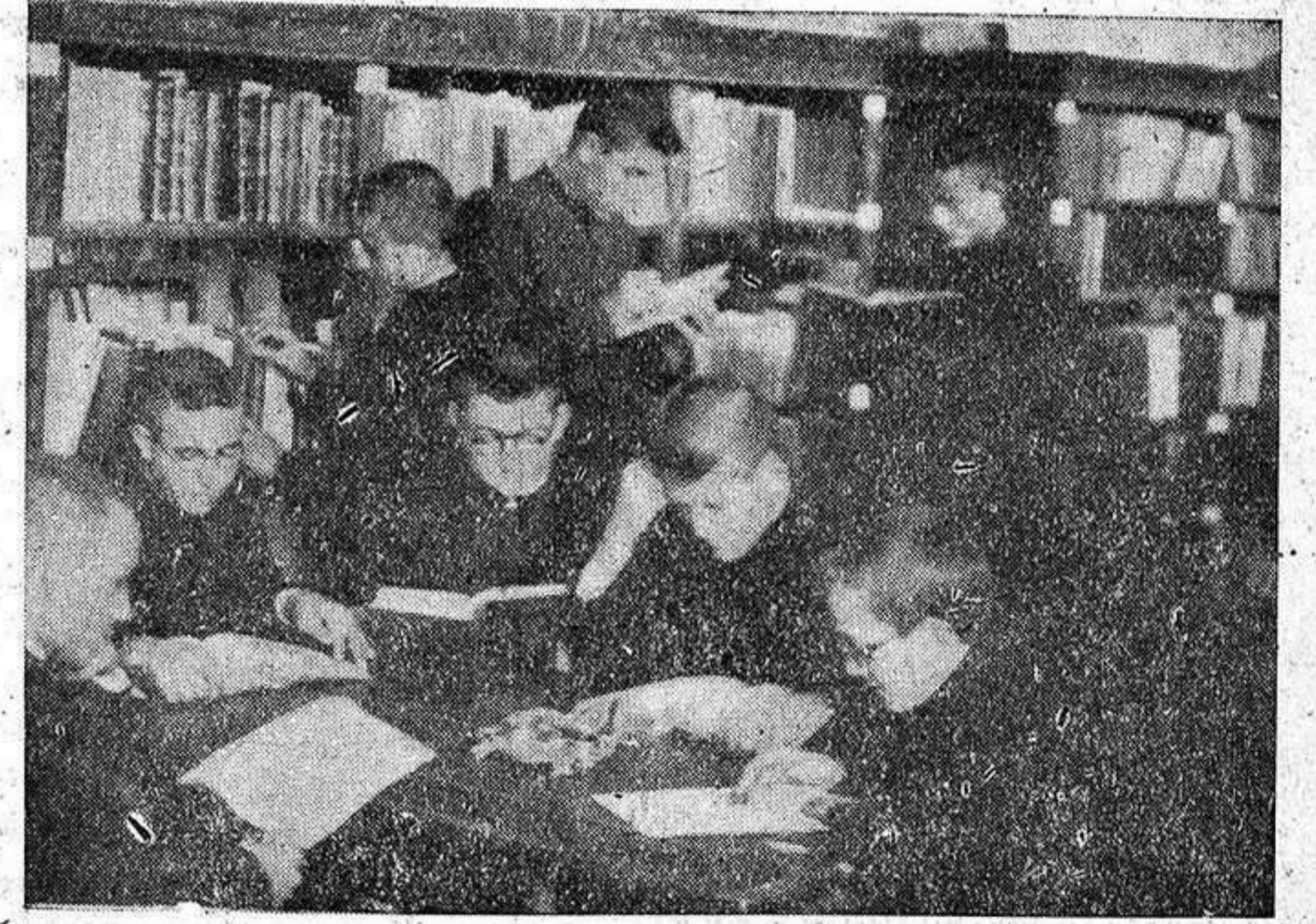
En pleno estudio en la biblioteca del Seminario.

Se necesitan, junto a un edificio pulcro y atrayente que abrigue toda clase de comodidades, sin rayar en el exceso y el lujo, y en que hasta las paredes hablan de finura y elegancia sacerdotal, sin caer en el extremo de la petulancia y ridiculidad mundana, una biblioteca voluminosa, que posea las obras más ilustres y las publicaciones de última hora en libros y revistas; unos gabinetes completos, en los que puedan estudiarse prácticamente las ciencias naturales y físicas; unas clases airosas y alegres con todo el bagaje pedagógico-científico que requieren los tiempos y un conjunto de medios tales, que encontrándose el seminarista en el ambiente que precisa para su formación, trabaje y se afane en