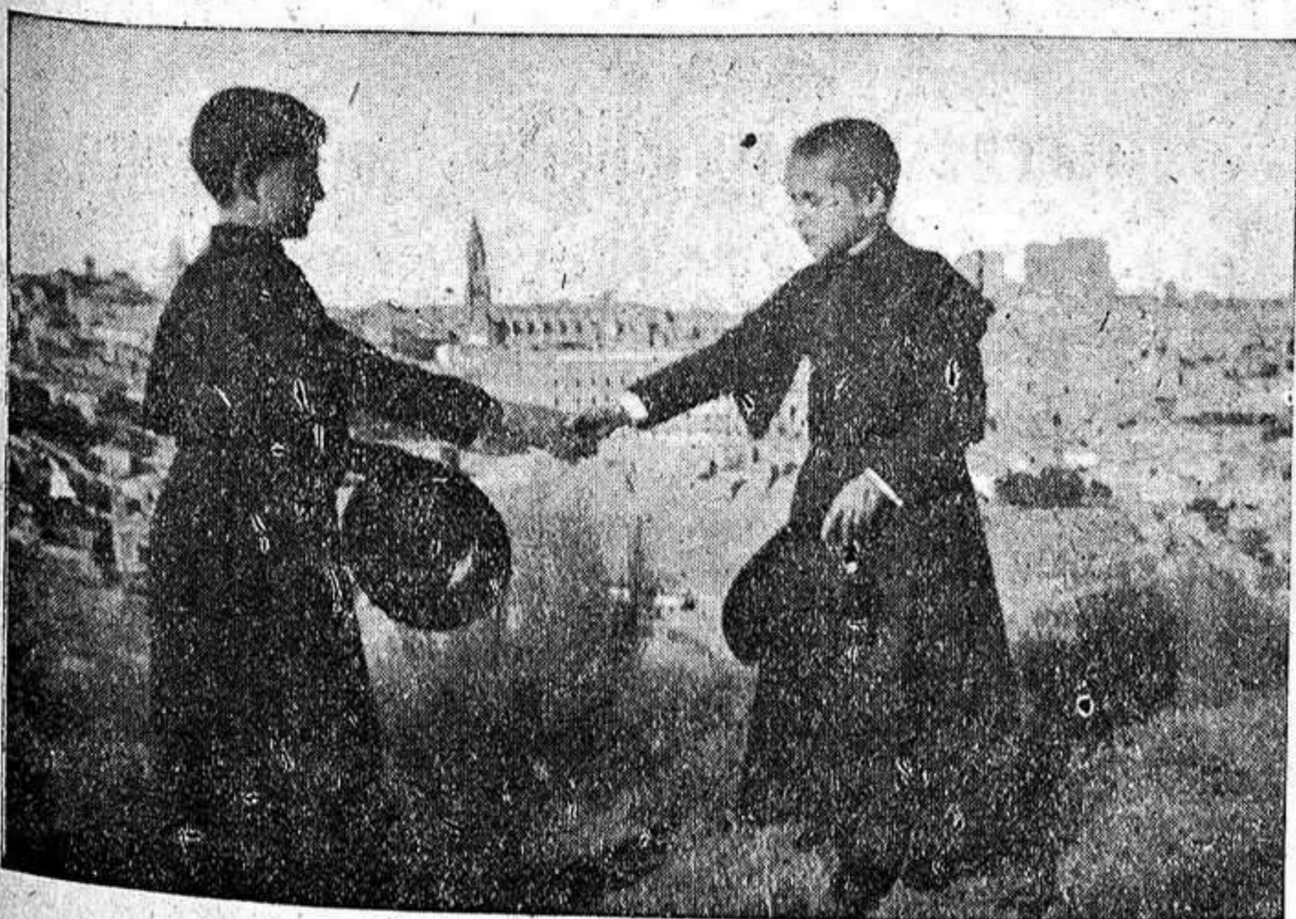
Sobre el fondo de la capital toledana, estos seminaristas se despiden antes de marcharse de vacaciones.