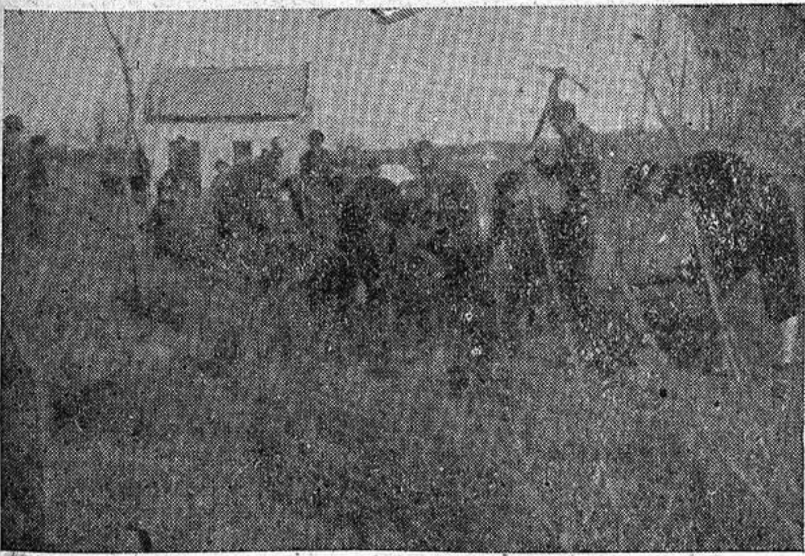
Los camaradas del F. de J. en un momento afanoso de la plantación de árboles para España.