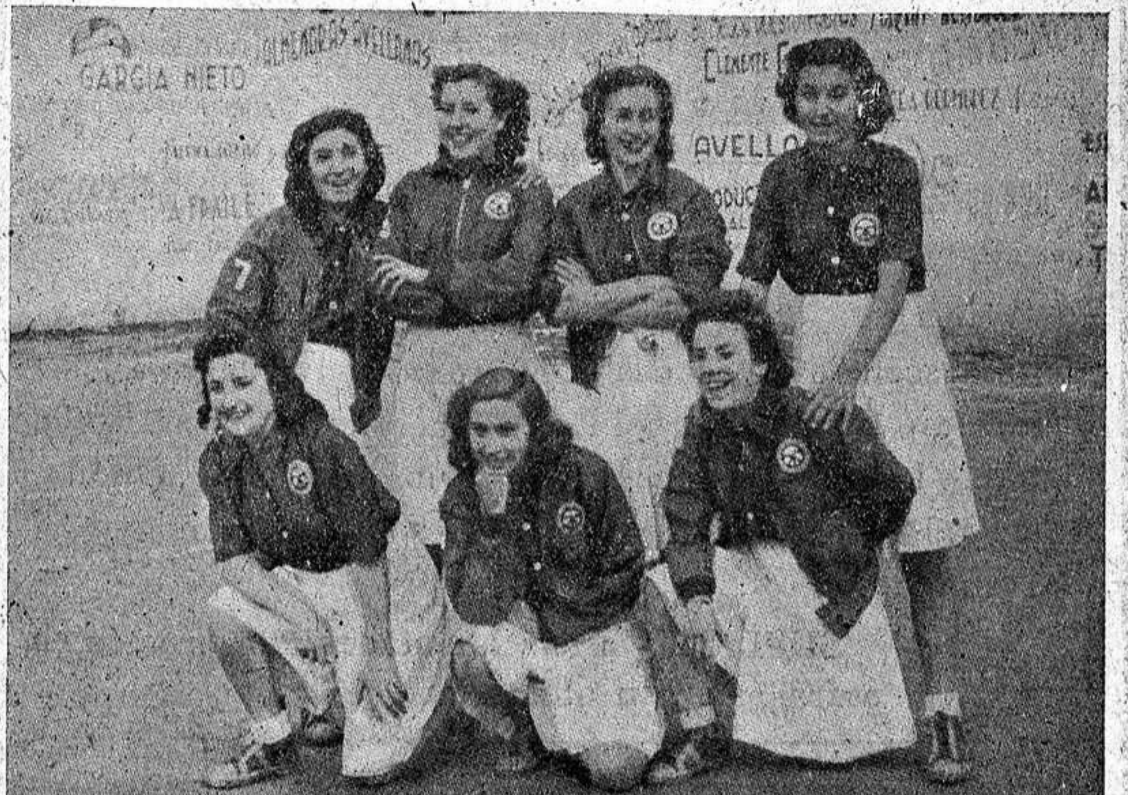
El equipo de baloncesto femenino de Educación y Descanso.

Cemento Valderrivas Ferretería TABERNE GUADALAJARA