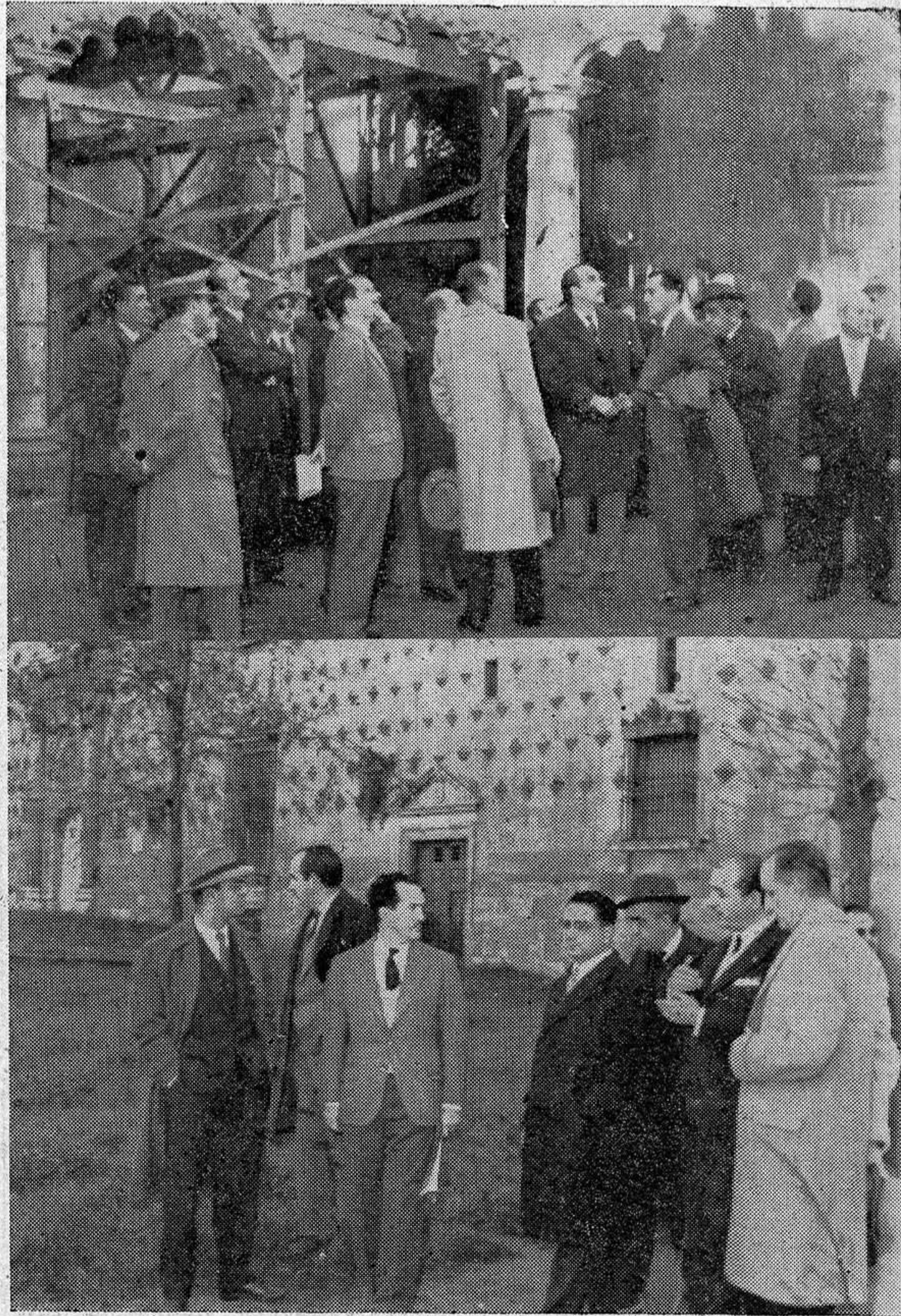
La visita a las ruinas del Palacio por parte de las autoridades y asistentes a la firma de la escritura de cesión, cerró como digno broche el acto celebrado en el Ayuntamiento.