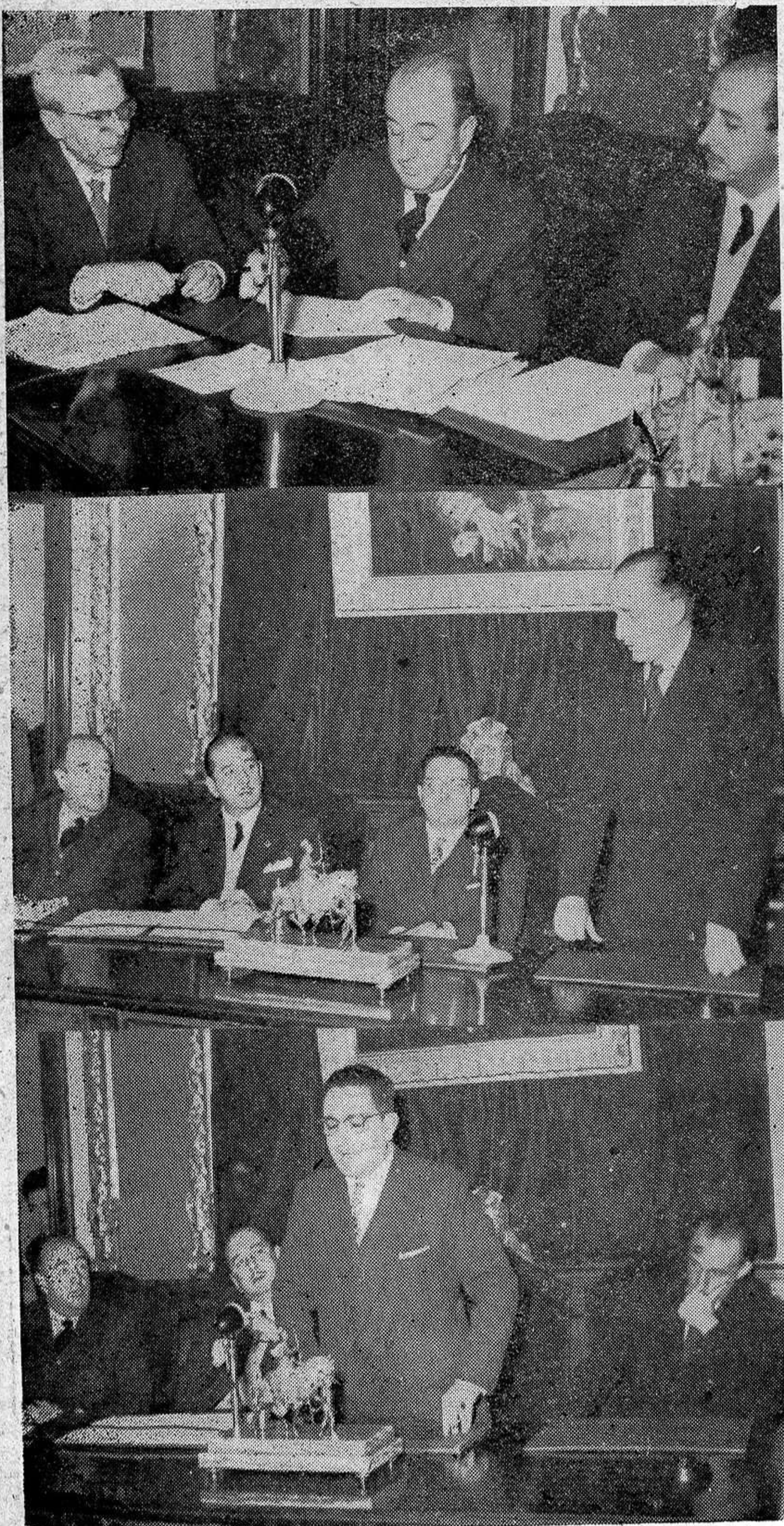
El alcalde de la capital en el momento de poner su firma en el trascendental documento. El duque del Infantado y el director general de Archivos y Bibliotecas sorprendidos por la cámara de Andrada durante sus importantísimas intervenciones.