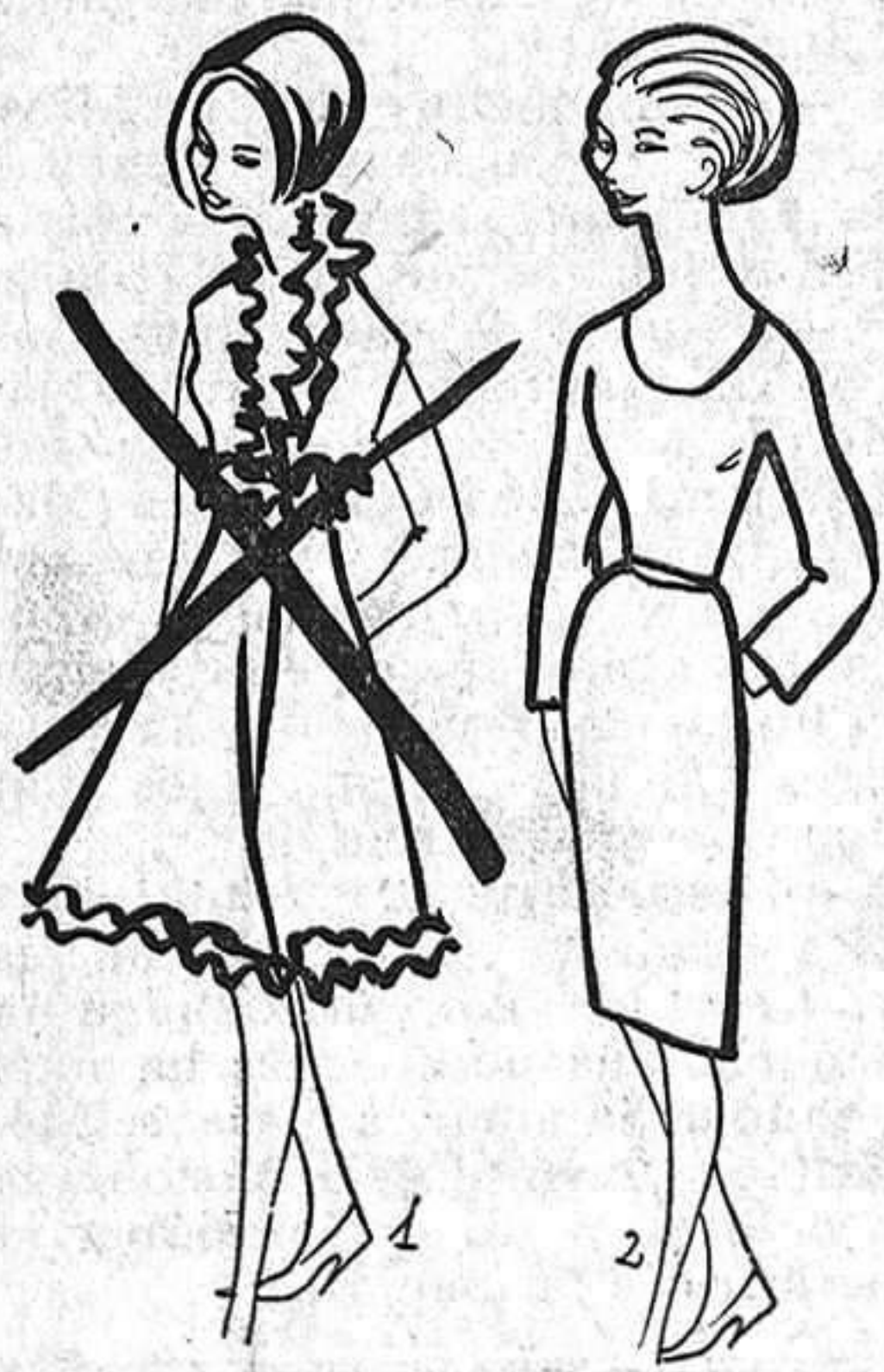
1 y 2. Siluetas que caracterizan la moda actual, una llena de fantasías y otra sobria, que se prepara para el próximo invierno.

Queda por ver lo que presentarán las otras firmas. De momento parece que nos espera una moda seria y sensata.