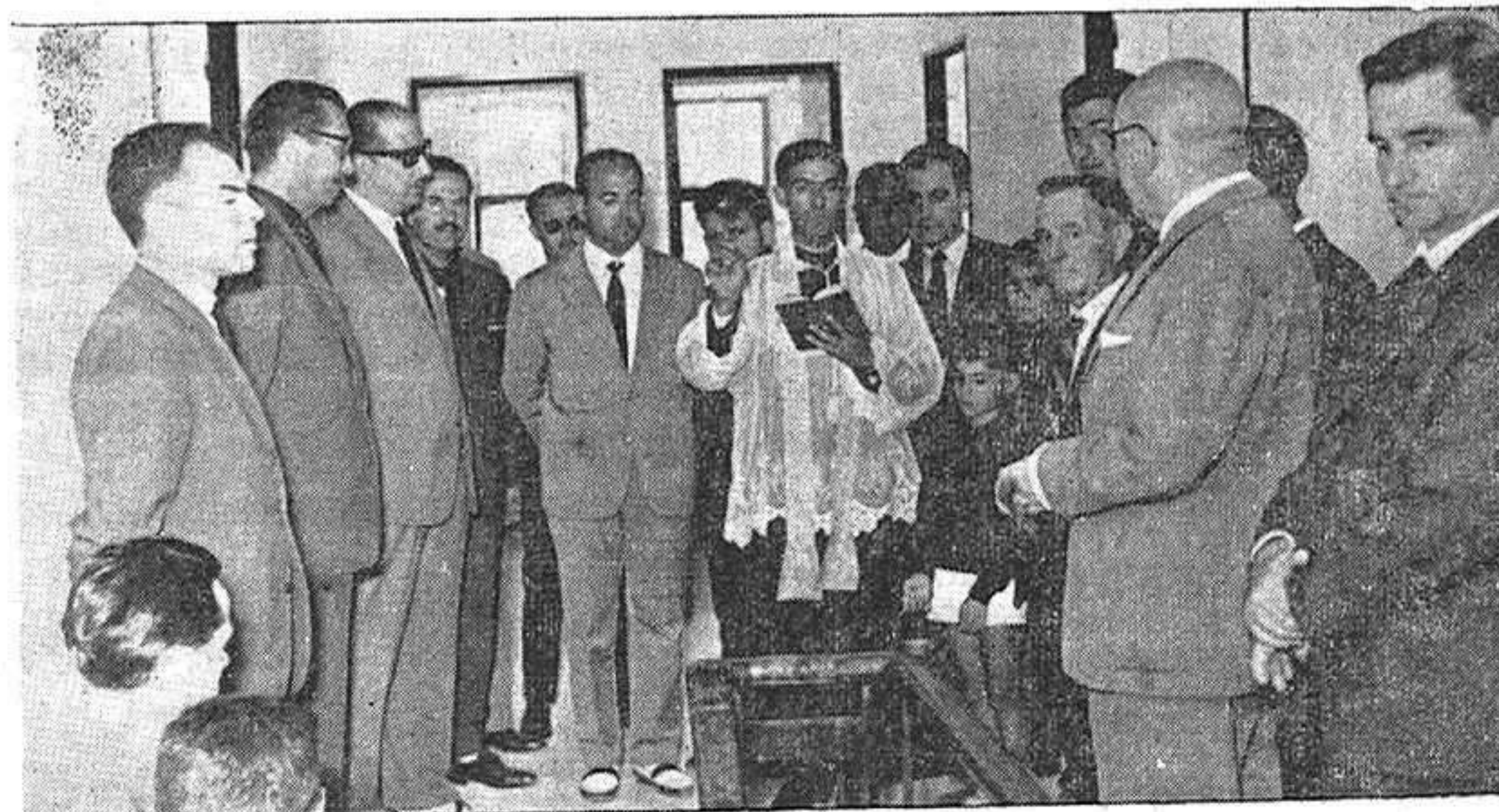
Un momento de la ceremonia de bendición del nuevo edificio que alberga al Ayuntamiento de Matillas y la casa del secretario.