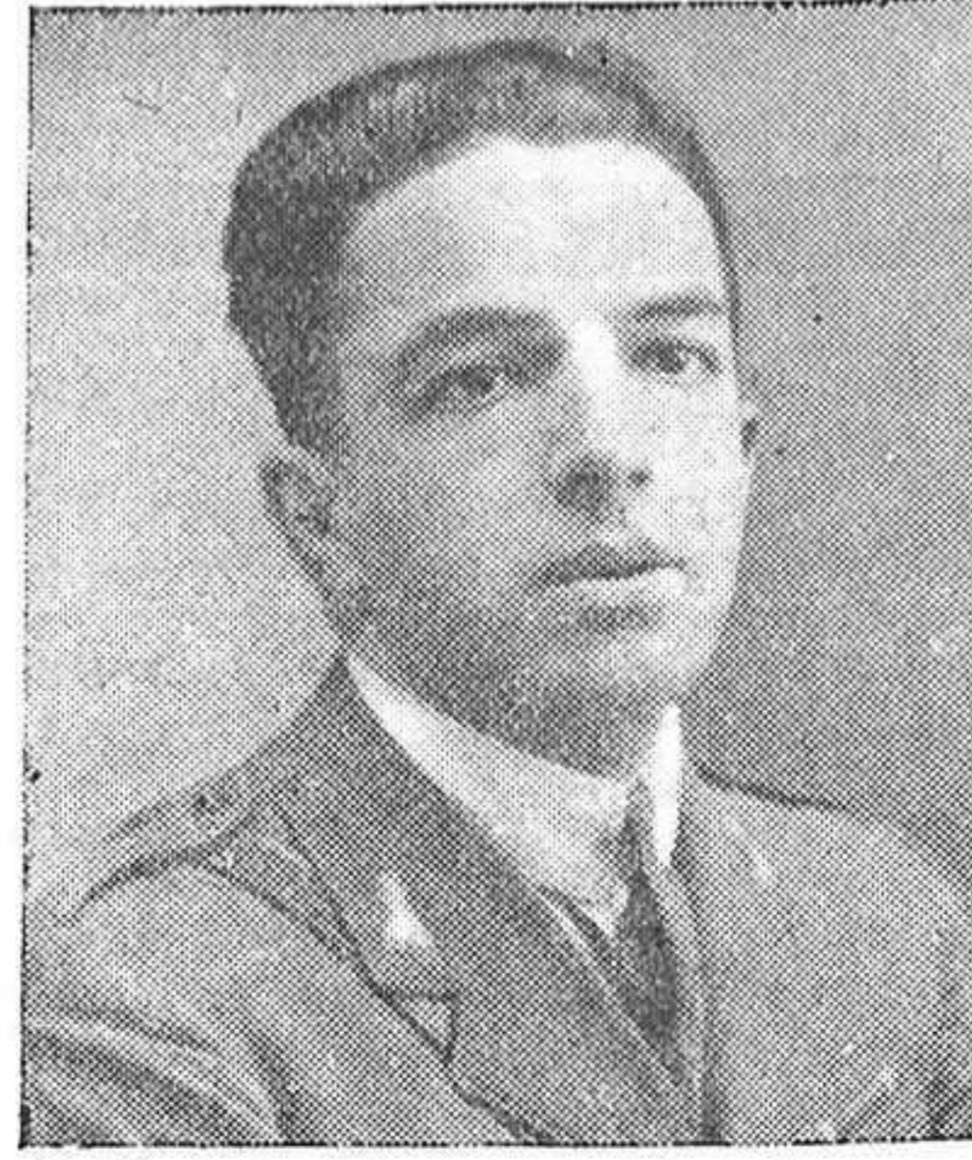
Don Alberto Albiñana Iraldivar, capitán de Ingenieros. Alzado en armas el día 22 de julio de 1936, hecho prisionero y encarcelado; siendo juzgado por el tribunal popular, que le condenó a muerte el 2 de noviembre de 1936; ejecutado el día 20 del mismo mes, murió mártir por Dios y por España, acreditando con su sangre gloriosa los altos ideales que profesaba.