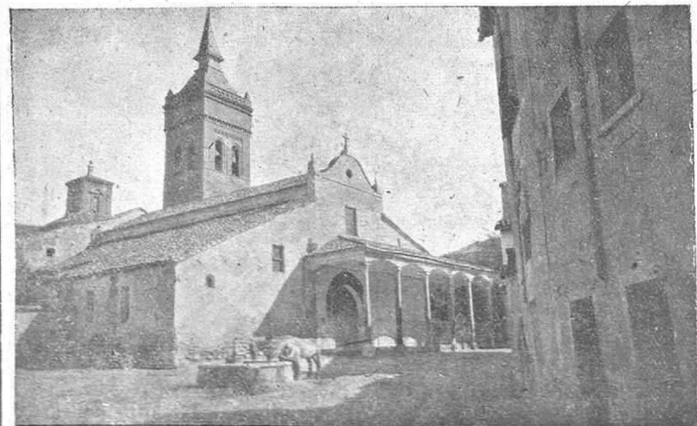
Una vista de la iglesia de Santa María. (Véase interesante reportaje en cuarta página.)

El plazo de inscripción se cerrará el día 10 del próximo mes de abril. Para mayores detalles, los interesados podrán dirigirse a dicha Junta Nacional, Avenida de José Antonio, 34, teléfono 13390, Madrid.