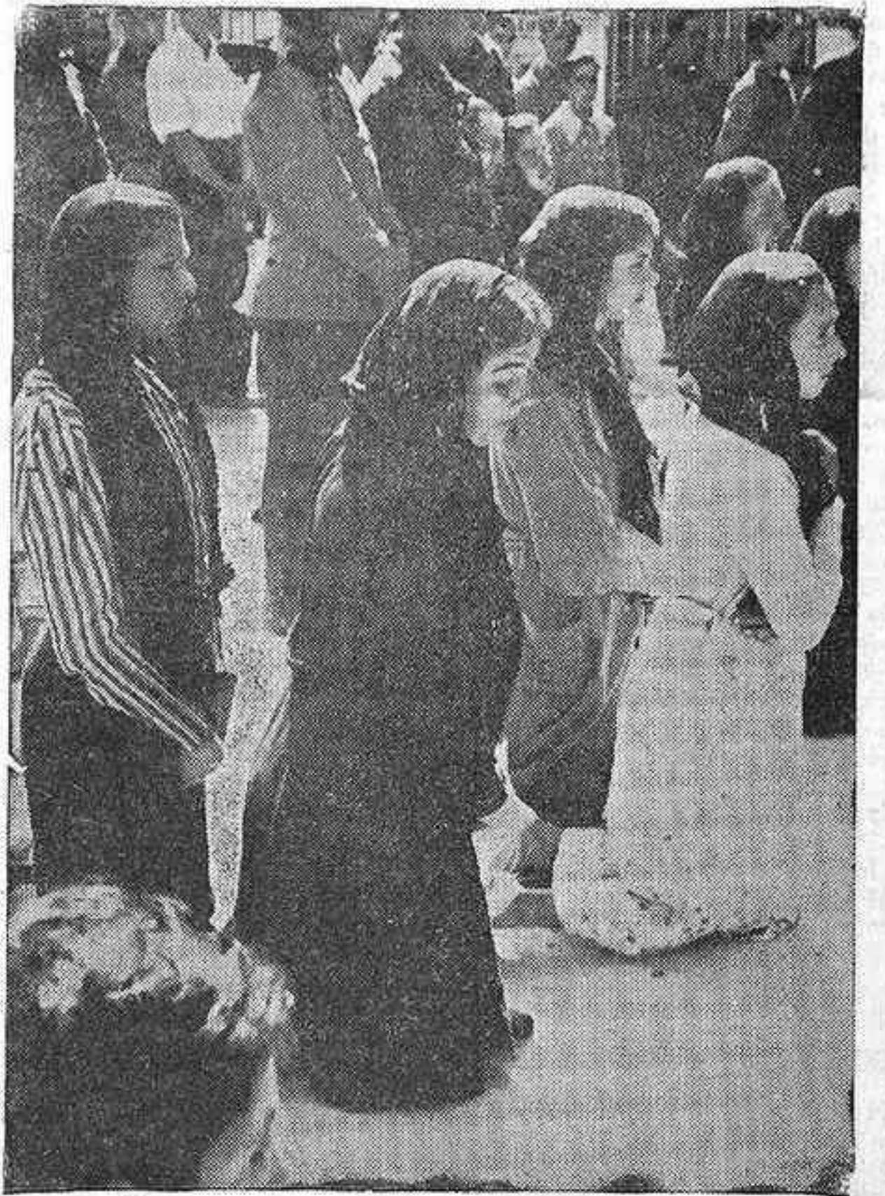
LA PRIMERA MISA EN VINAROS

Se tendrá especial cuidado de hacer constar, cuando a ello hubiere lugar, las anomalías o