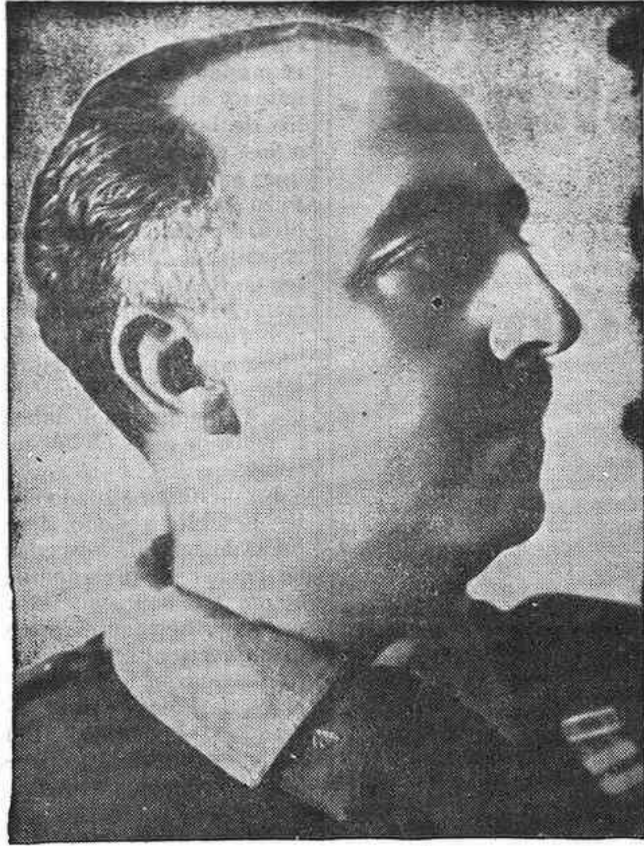
(VIENE DE LA 1ª PAGINA)