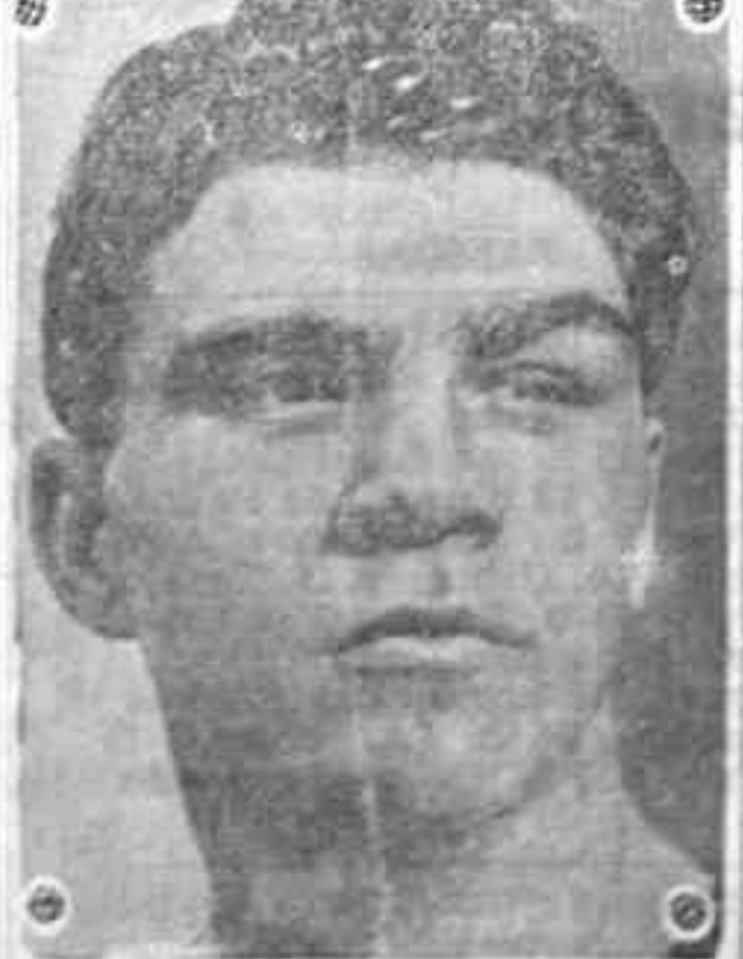
Retrato de los dos boxeadores, que han llevado a efecto con todo cuidado en Hamburgo, y dis-

No obstante, el tráfico, tanto en el río Elba como en el puerto se realiza con relativa puntualidad, desafiando a todos los elementos.