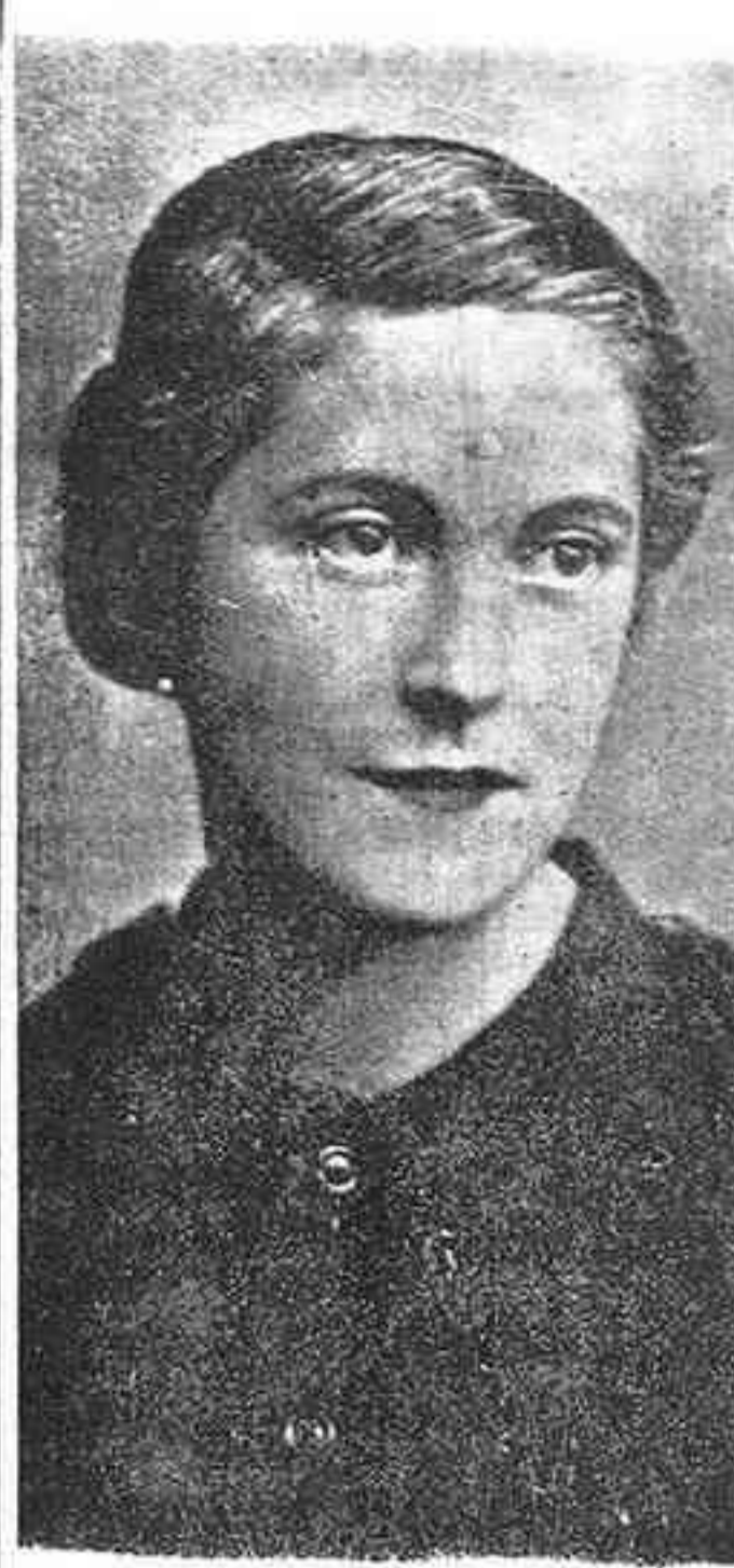
os corresponde la tarea callada

Igualdad número 1, esquina a la AVENIDA DEL GENERALISIMO FRANCO. Teléfono 3-7-4