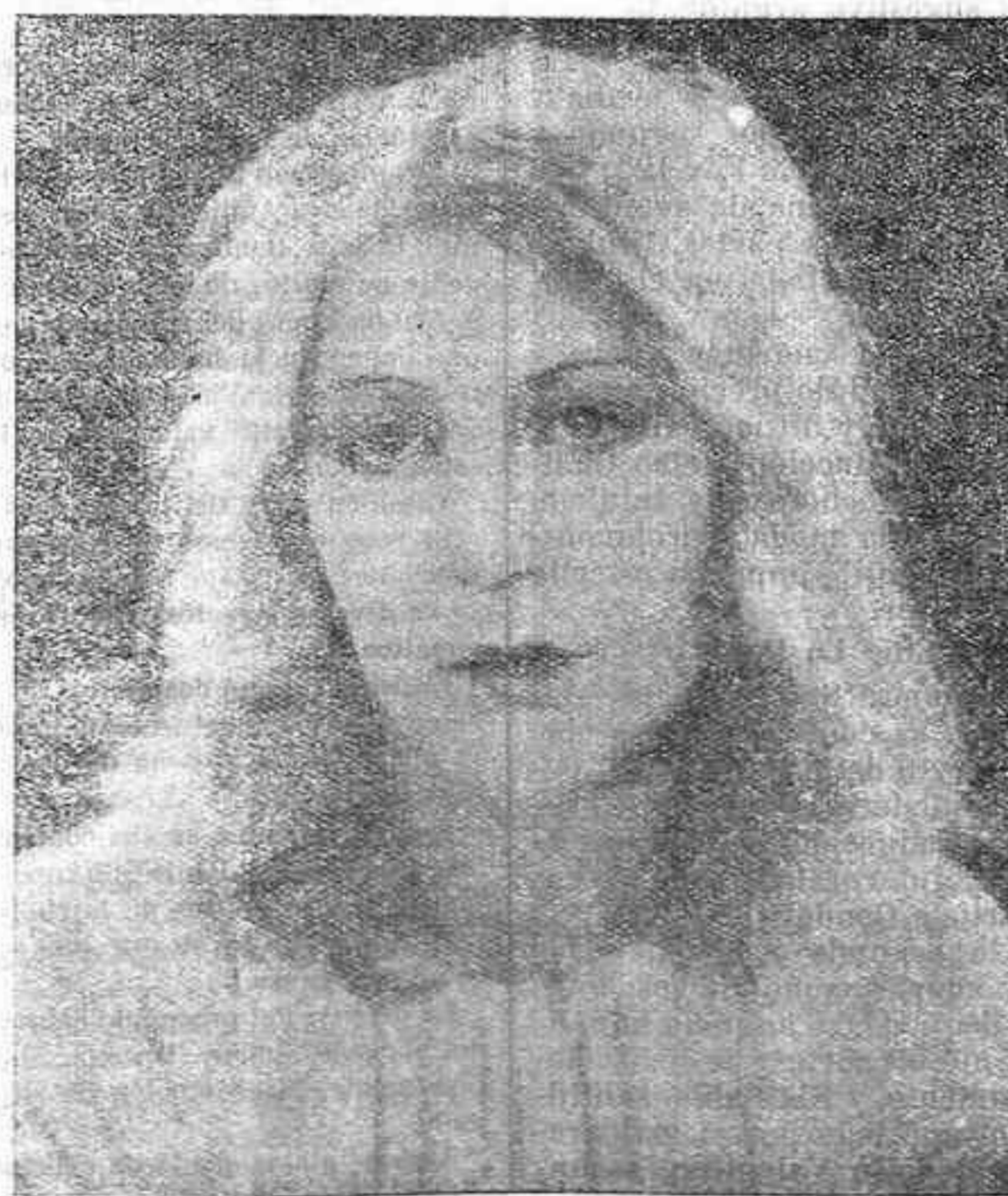
La notable y bella artista del arte mudo Lucienne Legrand, en el papel de protagonista que alcanza un verdadero éxito

ha llegado a tan alta cumbre que no ha alcanzado película alguna de cuantas se han proyectado sobre las pantallas de todos los cines del mundo.