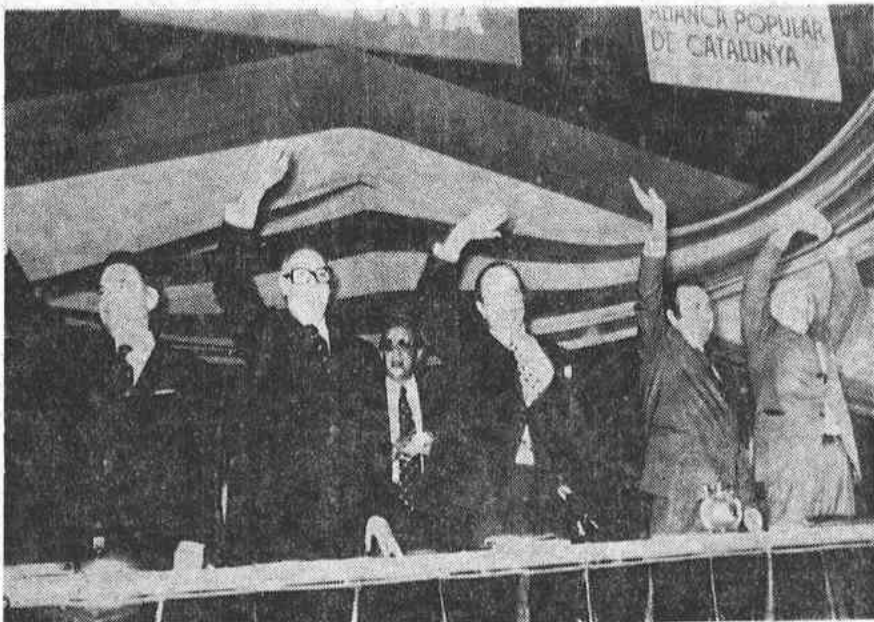
BARCELONA.—Se ha celebrado en el Palacio de los Deportes de esta ciudad un acto político organizado por Alianza Popular de Cataluña. Entre las personalidades que asistieron al mismo se encontraban Gonzalo Fernández de la Mora, Laureano López Rodó, Manuel Fraga Iribarne, Cruz Martínez Esteruelas y Licio de la Fuente.—En la foto, las personalidades antes mencionadas.