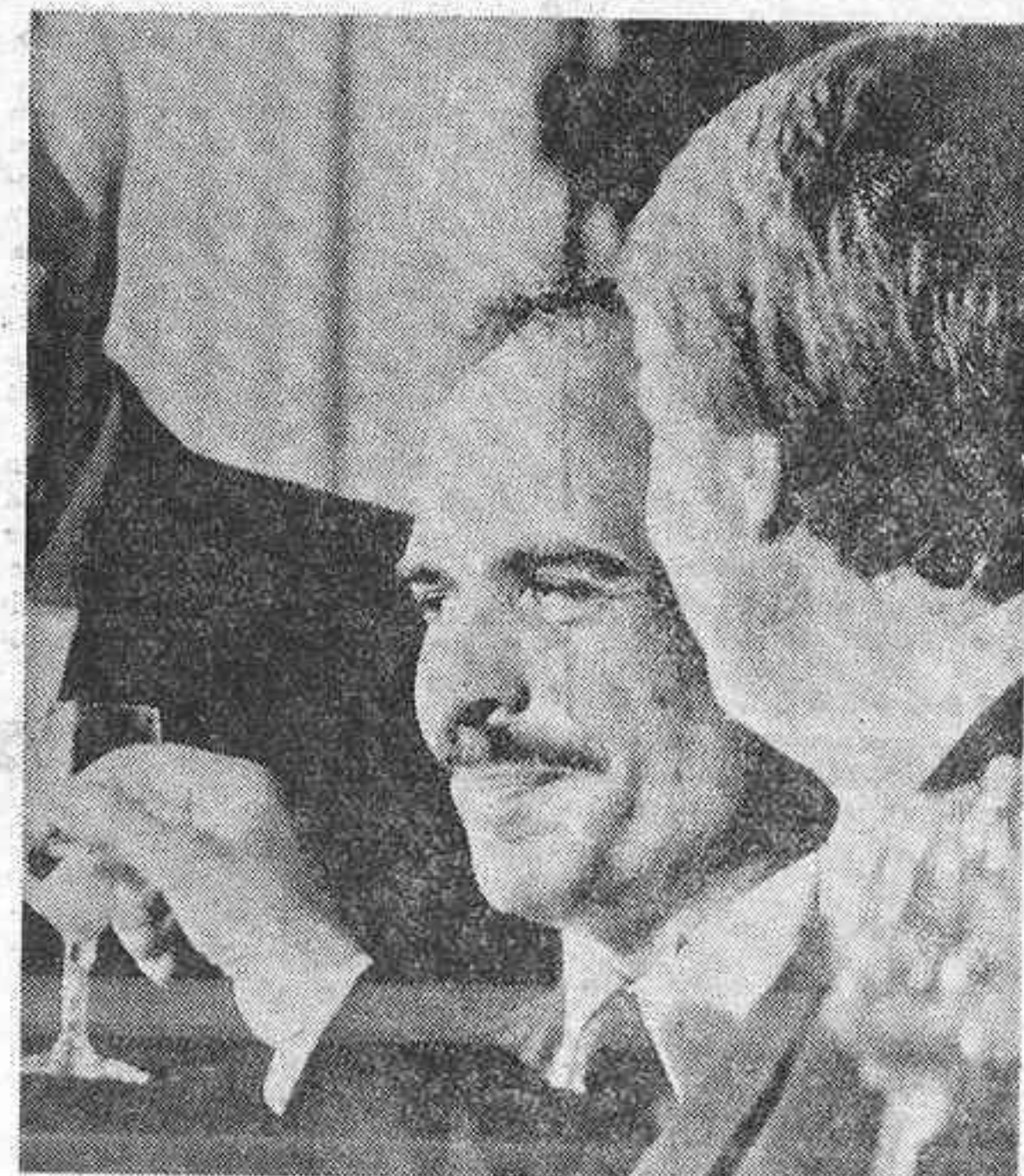
WASHINGTON.—El Presidente Carter levanta su copa brindando en honor del Rey Hussein de Jordania en el transcurso de una comida de trabajo en la Casa Blanca.