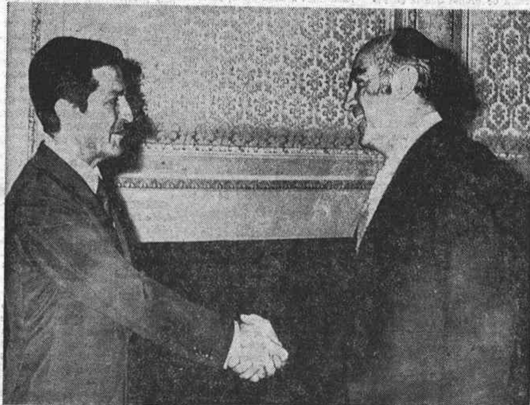
CIUDAD DE MEJICO.—El Presidente José López Portillo estrecha la mano del Presidente Suárez a la llegada al Palacio Nacional de Ciudad de Méjico, para sostener conversaciones de alto nivel, después del restablecimiento de las relaciones diplomáticas entre los dos países el pasado 28 de marzo.

Larga entrevista entre el Presidente del Gobierno español y el de Méjico