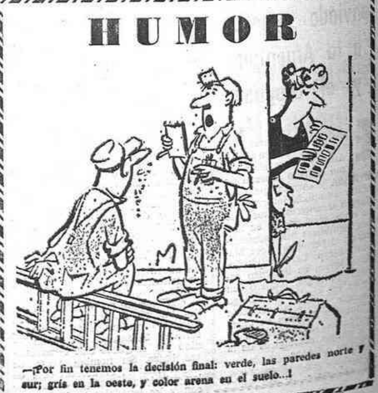
«Por fin tenemos la decisión final: verde, las paredes norte y sur; gris en la oeste, y color arena en el suelo...»

La prensa y la televisión japonesa calificaron la petición de Rogers "de ofensiva" aunque éste será uno de los temas más importantes de las conversaciones.